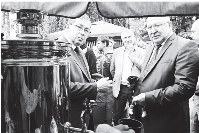
▲ «Городецкие промыслы... погружают в глубину веков...», - отмечает глава региона

- Наша задача - сохранить эти позиции и вырасти.