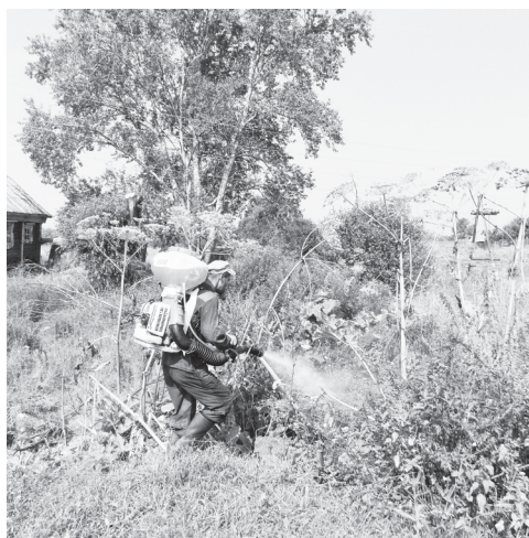
▲ Обработка борщевика в д.Рогово

Работы выполняло ГБУ НО «Агротеххимцентр». Вещества, которыми обрабатывали борщевик, очень токсичны, поэтому жителей населенных пунктов предупредили, что в течение трех дней выпас скота запрещен. Как сказали нам в управлении сельского хозяйства, в Рогове борщевик распространен больше всего.