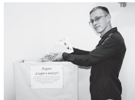
▲ Стартовала акция «Скоро в школу»

Редакция газеты присоединяется к акции «Скоро в школу». Мы, журналисты, приглашаем к участию и вас, наши читатели. Поможем вместе собрать детям свои портфели, наполним их тетрадками, ручками, карандашами и прочими принадлежностями. Канцтовары можно