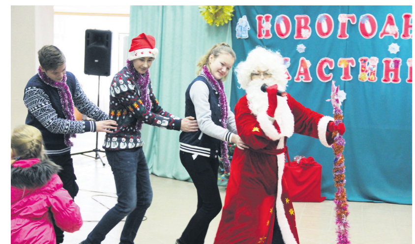
▲ Зажигательное выступление Тешинского СДК

Обширная программа, состоящая из выступлений 11 сельских Домов культуры, подняла настроение всем, особенно малышам. Участникам предстояло также пообщаться с залом во время своих выступлений, суметь заинтересовать и привлечь аудиторию. Это удалось всем без исключения. Артисты Роговского СДК исполнили желания зрителей, записанные на снежинках, Поздняковского СДК