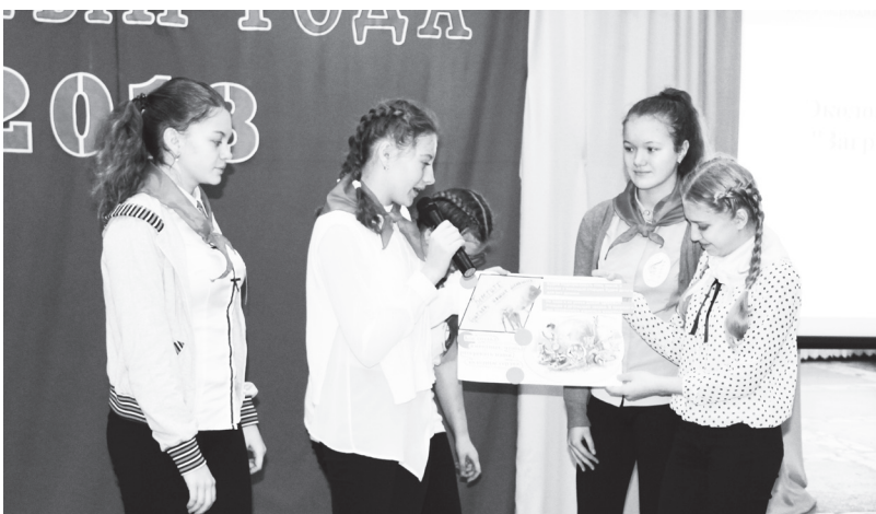
▲ Презентация проекта