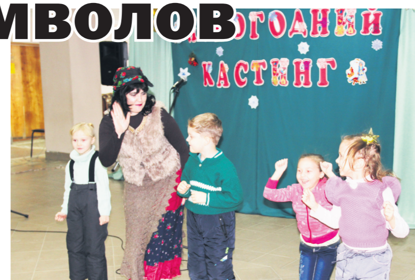
▲ Дети от души танцевали с доброй Бабой Ягой

напомнили всем своей сценкой русскую народную сказку «Снегурочка», но особенно ярко в этом плане сумели себя выразить Тешинский Дом досуга, Натальинский и Большеокуловский СДК. Тешинские таланты сумели вобрать в свое выступление элементы фольклора и нотки современности, привлекли на сцену мальчишек и девчонок, которые посоревновались с Дедом Морозом в умении танцевать. Натальинский коллектив представил номер с участием Кикиморы, Бабы Яги и Деда Мороза, которого бросила Снегурочка. Тогда сказочные герои объявили кастинг среди зрителей, чтобы найти Снегурочку. Настоящими звездами праздника стали артисты Большеокуловского СДК, их номер был по-настоящему зажигательным, забавным и направленным именно на общение с публикой. Неподражаемый Дед Мороз и Снегурочка сразу же очаровали зрителей, особенно смогли расшевелить самых маленьких, которые в ходе всего выступления просились на сцену поучаствовать в конкурсах и потанцевать рядом с любимыми новогодними персонажами.