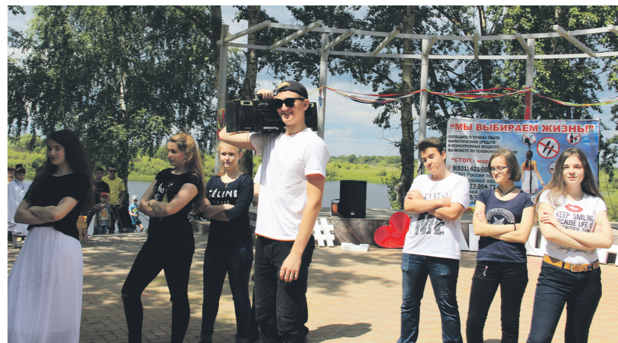
▲ Молодежь округа самая талантливая, энергичная и культурная... Зажигательный флешмоб от выпускников 9 класса гимназии