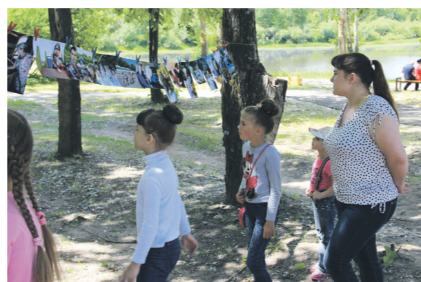
▲ Популярный проект «Фотосушка» впервые проводился в нашем городе. Все желающие могли посмотреть и оценить фотографии настоящих профессионалов