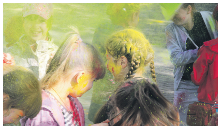
▲ Фестиваль вызвал бурю эмоций у детей и, надеемся, не слишком шокировал родителей разноцветной одеждой