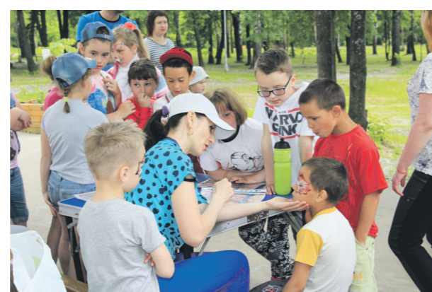
▲ Даже нехитрая забава - аквазрим дарит ребятам массу положительных эмоций...