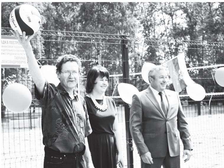
▲ Дорогу волейбольному движению в Навашине!