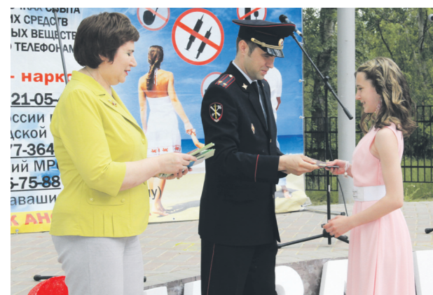
▲ Юным навашицам торжественно вручили основные документы, удостоверяющие личность - паспорт гражданина РФ

25 июня в городском парке и на главной площади города состоялись праздничные мероприятия, посвященные Дню молодежи