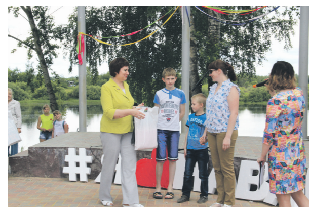
▲ Семья - это целый мир, отдельная вселенная, в которой есть устав, свои правила и нравы. Семья - это дом, мир и, конечно, дети. Награждение семей, которые совсем недавно стали носить гордое звание - многодетные