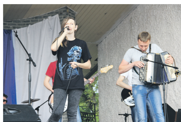
▲ Навашинская рок-группа «Крад-Да» «зажгала» на главной сцене города