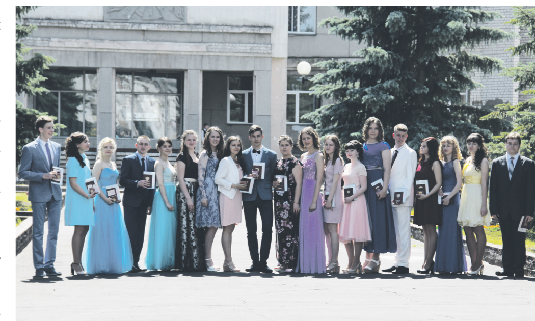
▲ 19 медалистов - есть, кем гордиться!

Во Дворце детского творчества состоялось торжественное чествование лучших выпускников городского округа Навашицкий. Они получили самые главные и значимые школьные награды - золотые медали за особые успехи в учении.