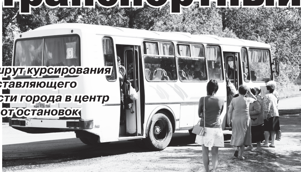
▲ Новый маршрут составлен с учетом пожеланий жителей

С 3 июля изменится маршрут курсирования городского автобуса, доставляющего пассажиров из южной части города в центр и время его отправления от остановок