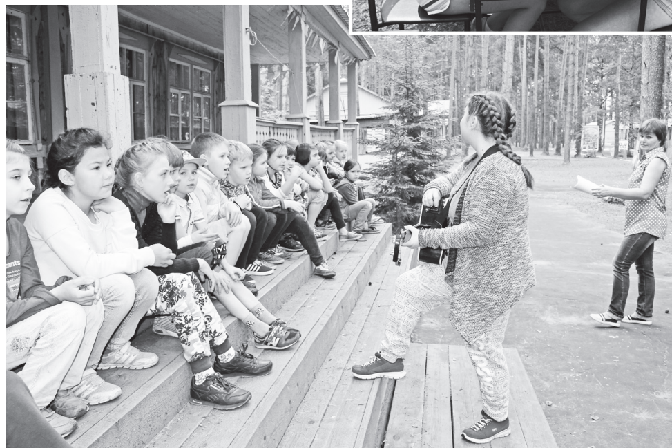
▲ На протяжении всего отдыха в загородном лагере ребят ждет много интересных событий