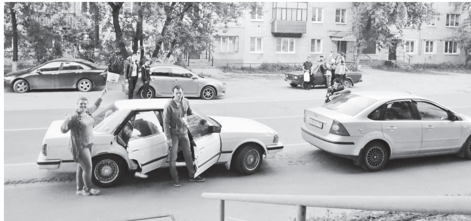
▲ Команды готовы к старту

Старт экипажам был дан в Центральной библиотеке директором библиотеч-