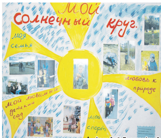
▲ Аркадий Левин, 4 года «Солнечный круг моего детства»

Рисунки остальных участников конкурса будут размещены в выпуске от 16 июня.