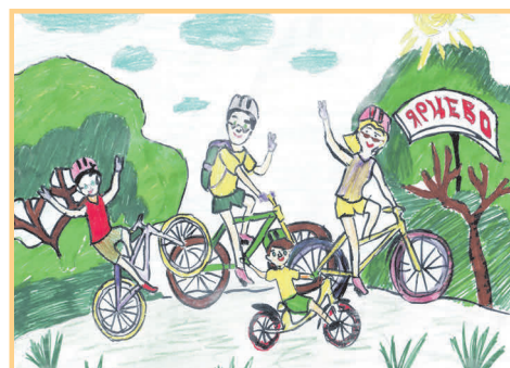
▲ Кирилл Папин, 6 лет «Велосипедная прогулка»