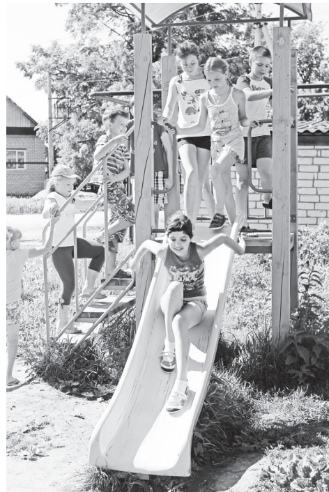
▲ При сельских домах культуры традиционно будут организованы прогулочные группы

просов предупреждения безнадзорности и правонарушений несовершеннолетними, организации отдыха, оздоровления и занятости детей и подростков, состоящих на профилактических учетах в субъектах системы профилактики. На межведомственном контроле находятся 15 подростков, за ними закреплены наставники из числа членов комиссии по делам несовершеннолетних и представителей образовательных организаций, где подростки обучаются. В мае совместно с МУК «Навашинское СКО» проведен семинар для работников культурных учреждений. Доведены все необходимые сведения о подростках, требующих особого внимания, поставлены задачи по работе с ними. В течение летнего периода продолжатся разъяснительные беседы с детьми, отдыхающими в лагерях, о несчастных случаях, в том числе на объектах железнодорожного транспорта.