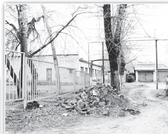
▲ Строительные отходы рядом со школой №3

Результаты месячника по благоустройству, стартовавшего в городском округе 5 апреля, уже очевидны, но и проблем еще предостаточно. О них постоянно сообщают горожане, открылись они и нашему взору, когда мы отправились по улицам города, чтобы определить их санитарное состояние. Безусловно, все снимки, так называемых, злчных мест не поместить в газету, как, впрочем, не хватит места и для фотографий, сделанных на тех территориях, где уже наведен порядок. Это и не главное. Важно, чтобы каждый помнил: быть чистоте или нет - зависит от нас!