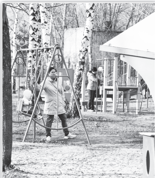
▲ Всей семьей - в ухоженный парк