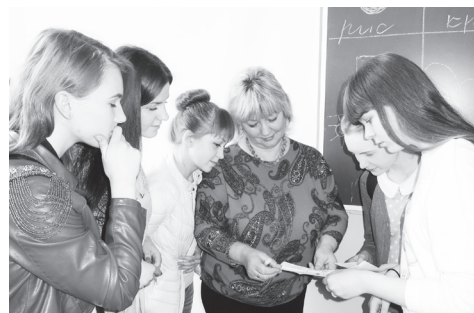
▲ В детской аудитории

Организовали его управление образования администрации городского округа Навашинский и антинаркотическая комиссия округа. Всего были три площадки, где рассказывали школьникам, студентам и их родителям о пагубных привычках, их вреде. А для преподавателей были зачитаны лекции специалистами «Детского оздоровительно-образовательного центра Нижегородской области «Дети против наркотиков».