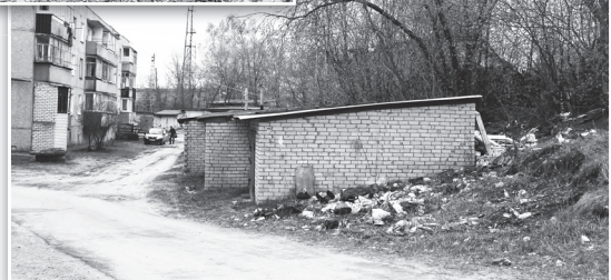
▶ Скопление бытовых отходов у гаражного массива продолжается в сторону пл. Ленина за модульной котельной на ул. Лепсе.