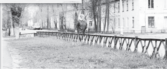
▶ По улице Калинина приятно пройти