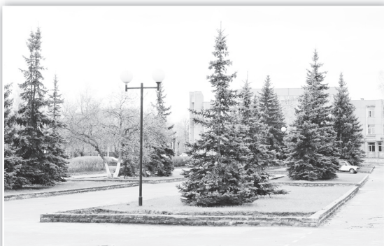
◀ Центральная площадь города преобразается на глазах