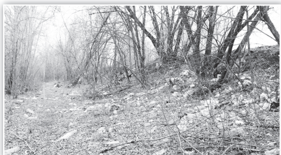
◀ Свалка на ул. Дорожная начинается еще от поворота к тоннелю и продолжается вплоть до выезда на объездную дорогу

Результаты месячника по благоустройству, стартовавшего в городском округе 5 апреля, уже очевидны, но и проблем еще предостаточно. О них постоянно сообщают горожане, открылись они и нашему взору, когда мы отправились по улицам города, чтобы определить их санитарное состояние. Безусловно, все снимки, так называемых, злчных мест не поместить в газету, как, впрочем, не хватит места и для фотографий, сделанных на тех территориях, где уже наведен порядок. Это и не главное. Важно, чтобы каждый помнил: быть чистоте или нет - зависит от нас!