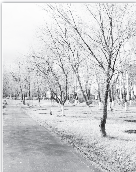
▲ Чистые аллеи встречают гостей города