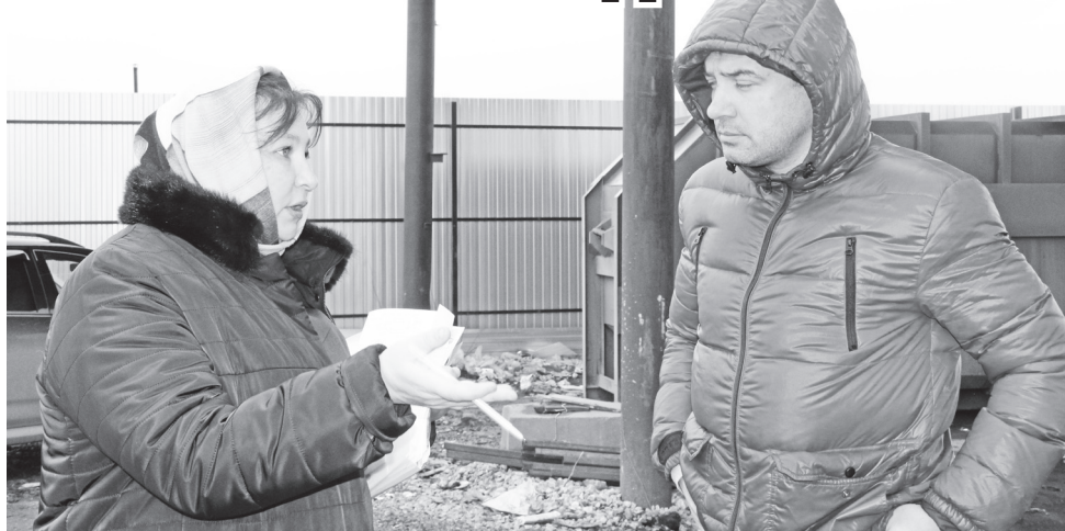
▲ На территории МПС: диалог состоялся

Действительно, мы могли сами убедиться, как производится перегрузка ТКО: безостановочно, лязгая ковшем по бетону, работал экскаватор, сгребая мусор. Также мы увидели, что оборудование МПС позволяет проводить не только мусороперегрузку, но и производить уплотнение мусора специальной прессовальной установкой. Мусор перегружается в большегрузные мусоровозы, которые уже везут его на Богородский полигон.