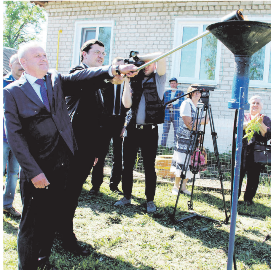
Пуск газа в с. Монаково

В соответствии с требованиями статьи 35 Федерального закона от 06.10.2003 № 131-ФЗ «Об общих принципах организации местного самоуправления в РФ» и Устава городского округа Навашинский, представляю вашему вниманию отчет о своей деятельности и работе Совета депутатов городского округа Навашинский за 2018 год.