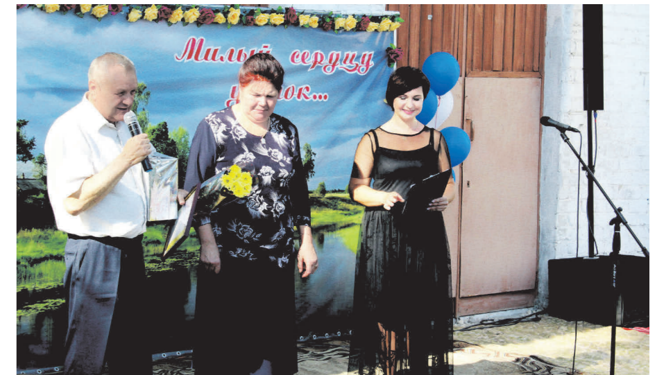
День села Монаково

го здания МБОУ «Гимназия» в г. Навашино;