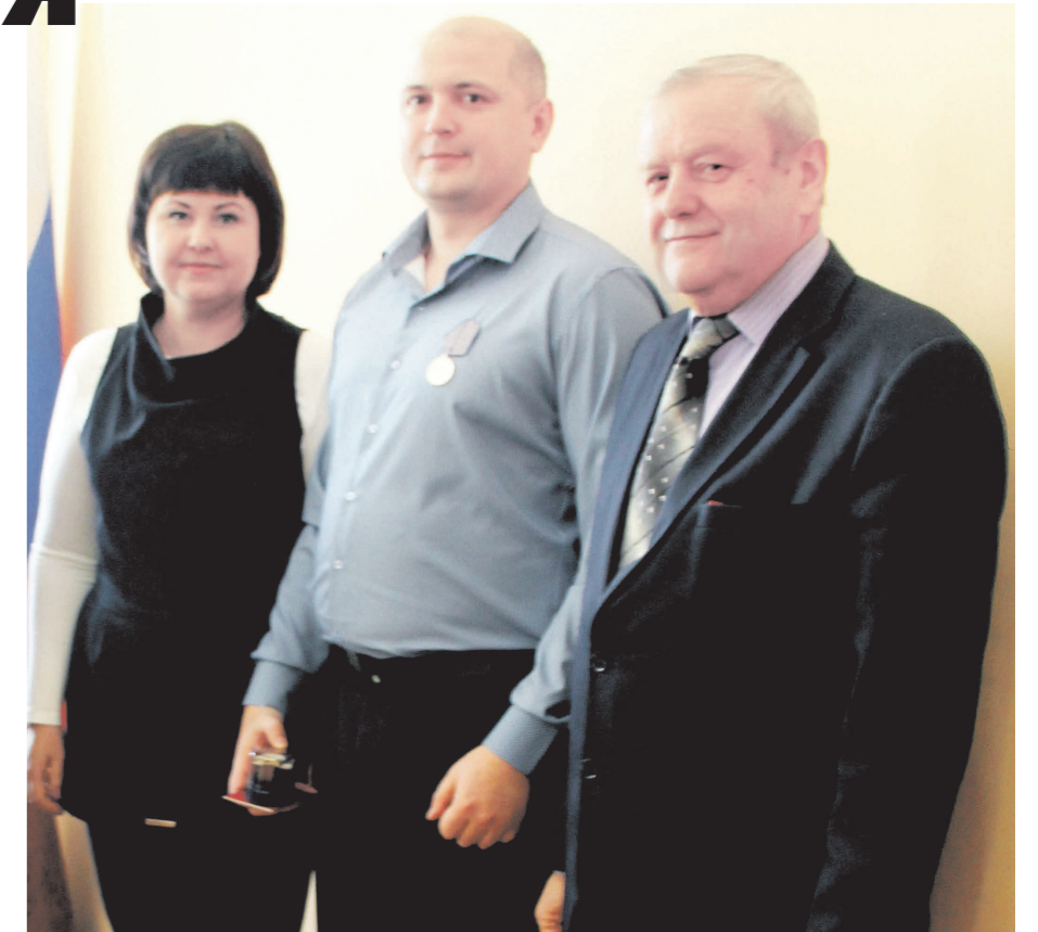
Вручение медалей участникам военных событий в Сирии

Каждый новый день ставит новые задачи, появляются новые проблемы, но мы не собираемся останавливаться на достигнутом. На текущий 2019 год нас намечены планы по актуальным для нашего округа вопросам: – завершение капитального ремонта Дворца культуры городского округа Навашинский; – благоустройство территорий в рамках федерального проекта «Формирование комфортной городской среды»; – ремонт дорог и тротуаров; – разработка проектно-сметной документации на строительство ново-