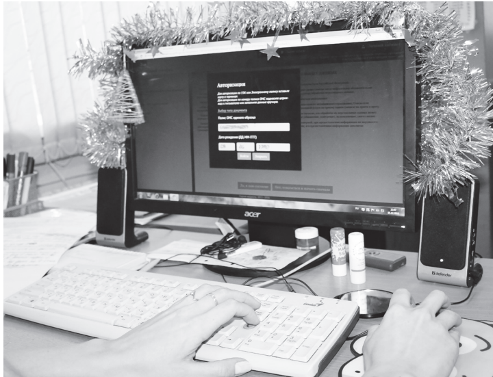
▲ Записаться на прием к врачу можно через интернет-сайт со своего компьютера