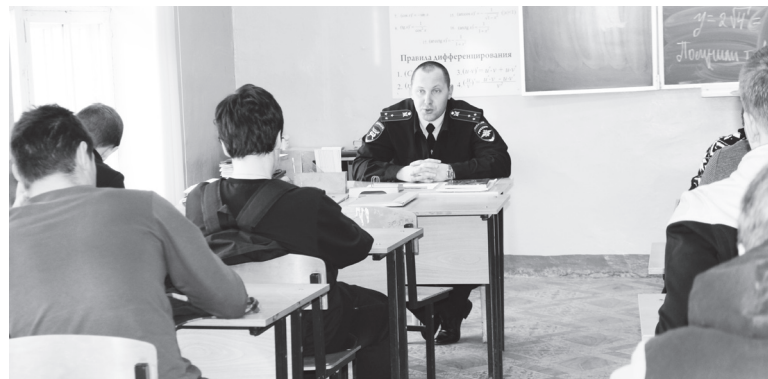
▲ Учащимся напомнили и о соблюдении правил дорожного движения

Ольга НОВИКОВА, специалист по связям с общественностью