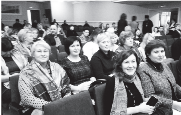
▲ Навашинская делегация на Рождественских чтениях