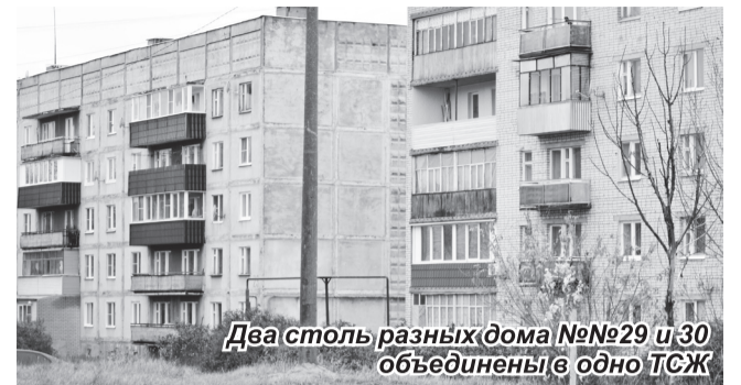
Два столь разных дома №№29 и 30 объединены в одно ТСЖ