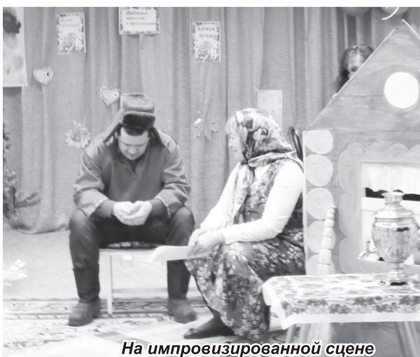
На импровизированной сцене

Ирина МИХАЙЛОВА