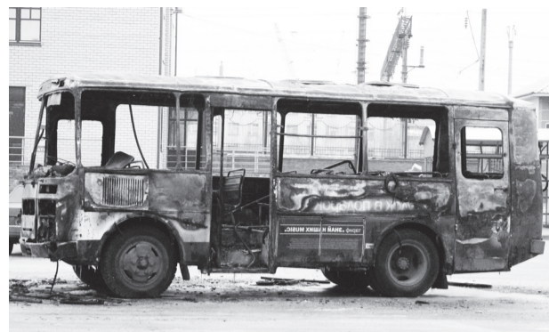
выгорел моторный отсек. По предварительным данным причиной пожара стала неисправность систем, механизмов и узлов транспортного средства.

В ликвидации огня были задействованы 5 человек и 1 автоцистерна 17 ПЧ и 4 человека и 1 автоцистерна 40 ПЧ 9 отряда ФПС. Тушение пожара, площадь которого составила 12 м 2 , длилось 3 минуты. К счастью, пострадавших в огне нет. Поврежден салон автобуса,