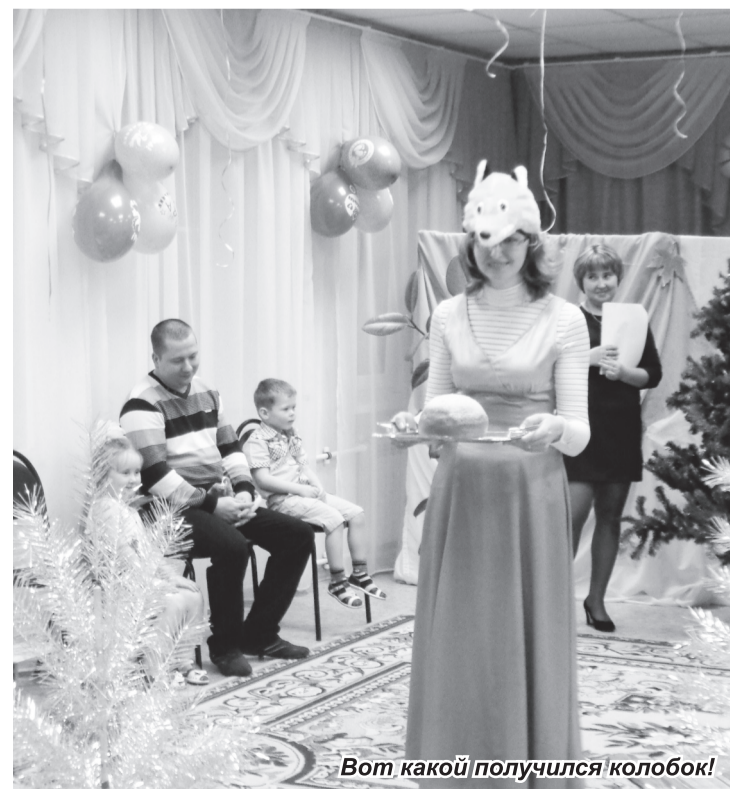
Вот какой получился колобок!