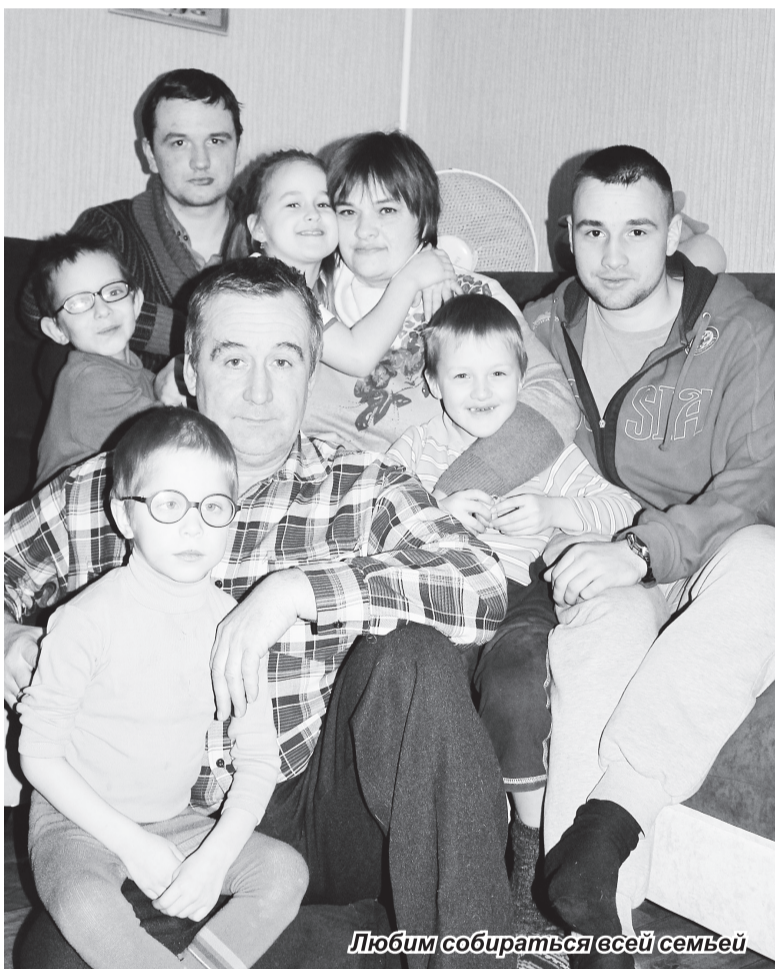
Любим собираться всей семьей