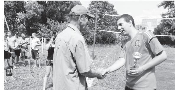
▲ Награждение лучших

Победу в футболбольном турнире одержали тешинцы. Во встрече по пионерболу команда младших девушек Натальинской школы выиграла у команды старших. Также параллельно турнирам в игровых