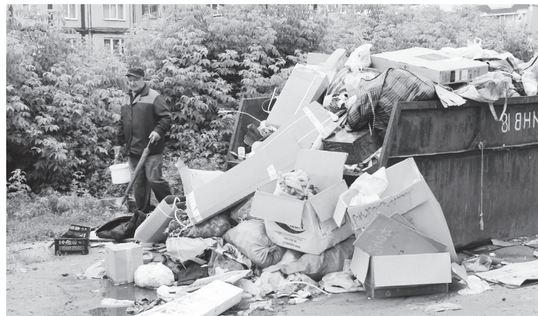
▲ Переполненный портал

- Как сказали нам представители компании, они не успевают