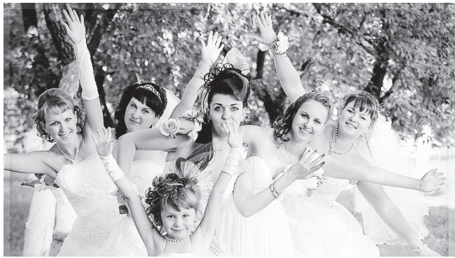
▲ Все - на Парад невест!

Желаете попробовать себя в роли невесты или хотите вспомнить свою свадьбу? Станьте историей города! Надевайте свадебное платье и быстрее на Парад невест, который состоится 26 июля, в рамках празднования Дня города и района.