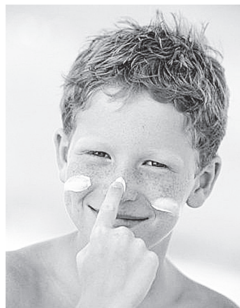
▲ Защити себя от ожогов

Если ваша кожа пострадала от солнца, первое, о чем следует позаботиться, так это об укрытии. Лучше всего - зайти в помещение. Если это невозможно - накрыться одеждой, минимально пропускающей ультрафиолет. После этого, чтобы кожу охладить и уменьшить болезненные ощущения, на обгоревшее место следует положить прохладный компресс. Если получен обширный солнечный ожог - можно постоять под прохладным душем. А еще лучше - полежать в прохладной ванне. Главное при этом - не травмировать кожу слишком сильными струями и мочалкой. Наиболее безопасными инструментами первой помощи при несильных ожогах яв-