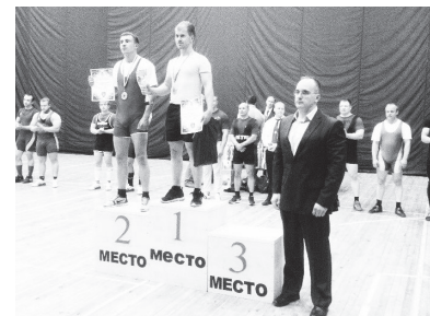
▲ На пьедестале

Ольга ЛЕОНТЬЕВА