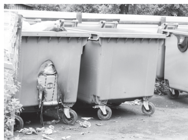
▲ Евроконтейнеры на ул.Московская, пострадавшие от рук вандалов