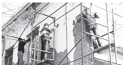
▲ К капитальному ремонту приступили

В случае, если в платежном документе суммы указаны некорректно, вам необходимо информировать регистратора для внесения соответствующих изменений в базу. Сделать это можно несколькими способами: обратиться в абонентские пункты обслуживания населения по вопросам оплаты услуг за ЖКУ (перечень действующих пунктов абонентского обслуживания можно найти на сайте Нижегородского фонда ремонта МКД в разделе «Собственникам жилья» http://www.fkrnnov.ru/?id=1919 ); написать обращение через официальный сайт