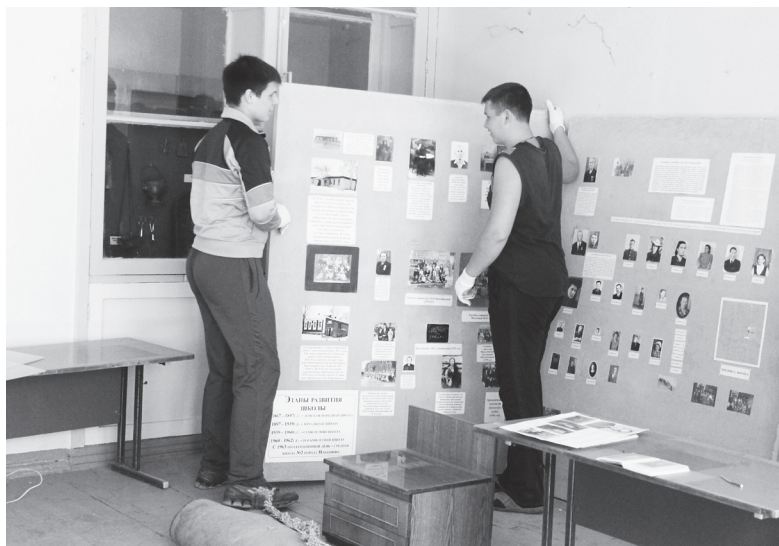
▲ Наводят порядок в школьном музее