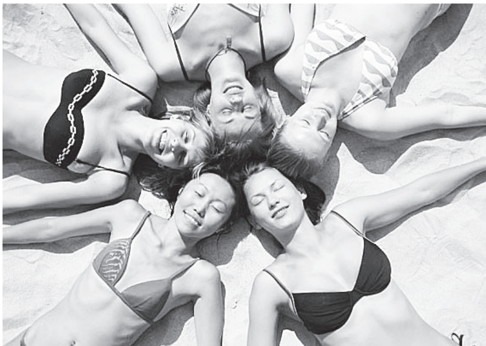
▲ Загорай правильно

Самая устойчивая к солнцу кожа у смуглых людей, с темными глазами и волосами. Чтобы получить ожог, им необходимо жариться под палящими лучами минут 40. Такие люди легко загорают, их кожа интенсивно темнеет и никогда не обгорает. Хороший загар обеспечен через 20 минут в первый же день. Обладатели русых или каштановых волос, сверкающие карими глазами, занимают второе место. От природы их кожа хорошо загорает, а в зимнее время выглядит смуглой. Ожог наступит через 20-30 минут пребывания на солнце. За один сеанс лучше провести на солнце не более 20 минут. Загар обеспечен через 1-2 дня. Голубоглазые блондины еще менее защищены от получения неприятных солнечных последствий. Им достаточно постоять на открытом воздухе в солнечный полдень всего 10-20 минут. Кожа загорает слегка, чаще краснеет, в первый день лучше не злоупотреблять солнцем больше 10 минут, в последующие дни можно попробовать побыть подольше - до 20 минут. Менее всего повезло людям с рыжими волосами и веснушками. Имея мраморно-белую кожу, они моментально обгорают за 5-7 минут, а за-