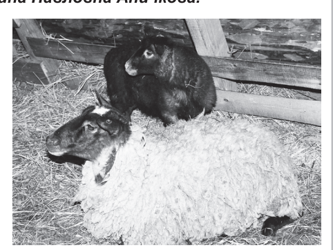
▲ Поголовье мелкого рогатого скота увеличилось

- Развиваются крестьянские (фермерские) хозяйства (КФХ). Практически на 13 тонн увеличилось производство молока за соответствующий