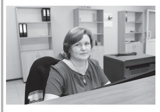
▲ МФЦ предоставляет новую услугу

- При приеме документов у будущего бизнесмена сотрудник МФЦ проверит его паспорт, засвидетельствует подпись и выдаст расписку в получении бумаг. Оплата госпошлины за регистрацию - 800 рублей. ИП или учредитель компании получит готовый комплект документов также у нас в МФЦ.