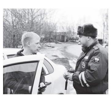
🛦 Проверка водителя

Именно под таким на- был выявлен ряд других нарушений. Так, навашинским экипажем было проверено 130 машин, выявлены такие нарушения, как два случая транспортным управления средством водителями без прав, шесть автолюбителей ездили без страховки, два случая нечитаемых номеров, одно нарушение правил пользования внешними световыми приборами и два нарушения управления транспортным средством для перевозки грузов или пассажиров без технического средства контроля. Выксунский экипаж проверил 98 автомобилей, выявлено