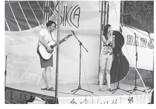
▲ «Крад-Да» на фестивальной сцене

Началу фестиваля положил двухчасовой концерт-открытие «По пути на фестиваль», который состоялся в ДК Металлургов. Затем участники направились к непосредственному месту проведения фестиваля бардовской песни - базе отдыха «Сосновый бор», которая находится в живописном районе на берегу старицы реки Оки