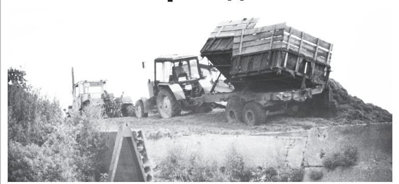
🛦 На силосной яме

18 июня, что на два дня позже прошлогодних сроков, навашинские аграрии приступили к заготовке грубых и сочных кормов. В этом году экспериментально, на пробу, с целью улучшения кормовой базы часть полей засеяли многолетними травами и не прогадали.