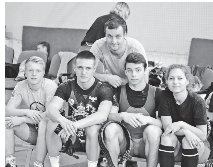
▲ Поскольку наша команда три раза выигрывала чемпионат области, то Кубок у нас останется навсегда