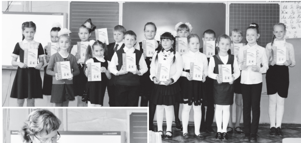
▲ Гимназисты – участники проекта

– Написание общей книги – серьезное дело. Для того, чтобы она была интересна, надо продумать все до мельчайших подробностей. Необходимо выбрать дизайн, фотографии, подходящие картинки. Но самым важным являются тексты. В книгу