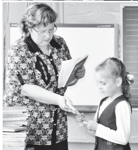
▲ Получение заветных экземпляров книги «На крыльях вдохновения»

моего класса «Собрание пестрых глав» вошли самые лучшие сочинения, заметки, репортажи, рассказы, созданные нами за пять лицейских лет для лицейского журнала, так сказать, «сливки». Наша книга – хронология, история нашего взросления. Это настоящая летопись класса: на первых страницах мы читаем, что писали, о чем думали в пятом классе, дальше – материалы шестого, седьмого, восьмого классов, а ближе к концу – наши надежды на будущее – письма самим себе, повзрослевшим на двадцать лет, – делится своим мнением