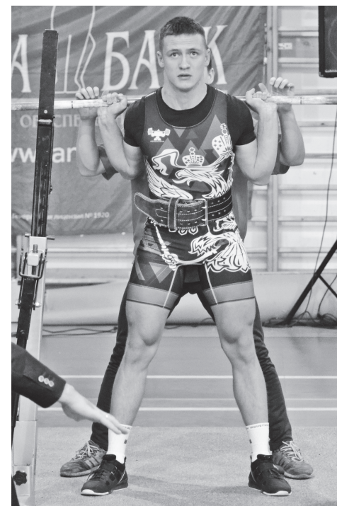
▲ В упорной борьбе