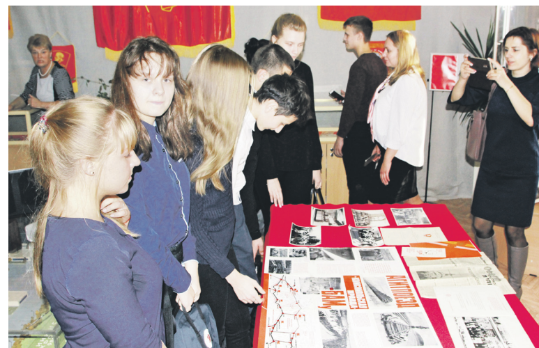
▲ Ребята знакомятся с историей комсомола

Ветераны комсомола со вспыхнувшим вновь огоньком и задором рассказывали ребятам о своей юности, о славных делах