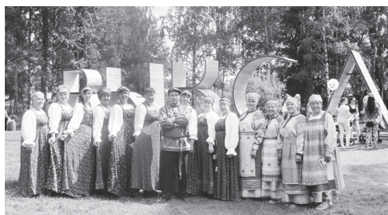
▲ Навашинские народные коллективы на фестивале в Выксе

Творческие коллективы муниципального учреждения культуры «Навашинское СКО» - народный фольклорный коллектив Поздняковского СДК и народный ансамбль «Радоница» Натальинского СДК - приняли участие в фольклорном фестивале «Голоса России», который проводился 18 июля в Выксе в рамках ежегодного фестиваля «Железная роза».