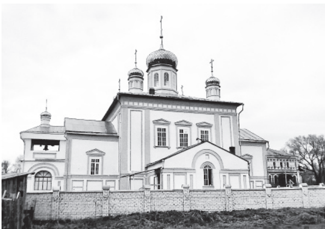
▲ Далне-Давыдовский монастырь

Перейдя мост через реку Теша и попав в деревню Горицы, нужно пройти по Овражной улице до конца и свернуть направо, на Советскую. Сразу за деревней можно увидеть развилку трех дорог. Неподалеку от нее, там, где крутой берег Теши переходит в пологий, есть курган, который появился здесь еще в незапамятные времена, когда в местных лесах жили разбойники. Они грабили и убивали проезжих купцов на старинном сибирском тракте, который шел от Давыдовского монастыря к Симбирску. Однажды они украли не только золото и драгоценности, но и дочь заморского купца. Привезя в свой стан добычу, разбойники решили поделить все награбленное. Все уда-