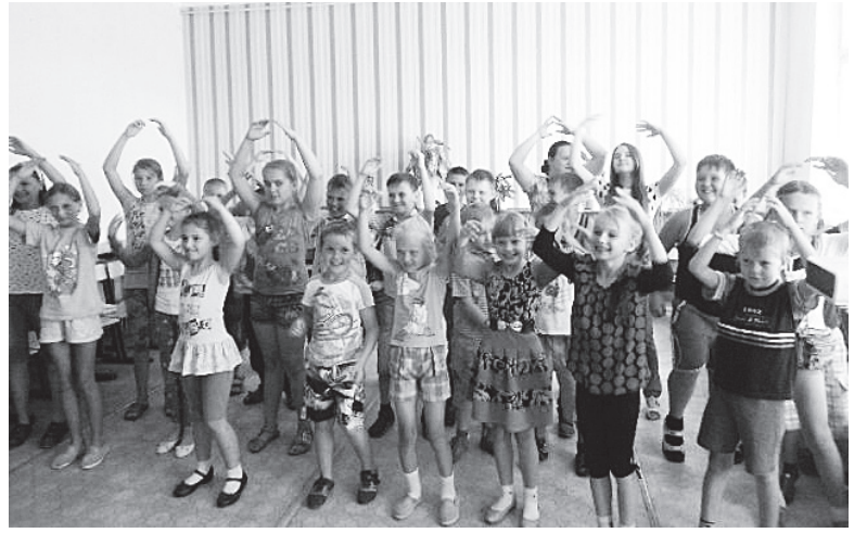
▲ Школьники весело проводят время в лагере

В качестве примера можно привести такие мероприятия, как музыкально-развлекательная программа «Детство - сказочная