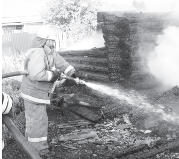
▲ Тушение пожара