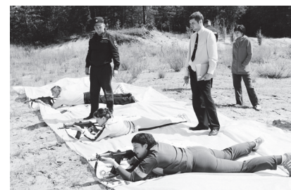
▲ На стрельбище

Сотрудники МО МВД России «Навашинский» Нижегородской области на карьерах в районе деревни Малое Окулово провели контрольные стрельбы из автомата Калашникова.