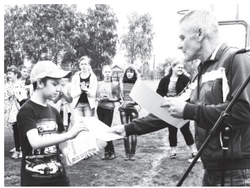
▲ Вручение наград призерам и победителям

В эстафете 4x50 м лучший результат показала команда из Теши. Второе место заняла команда из Натальина. Третьими стали участники команды из Степурина.