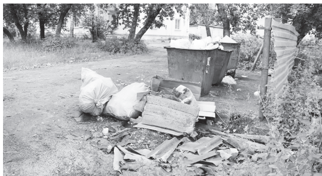
▲ Для строительного мусора буквально в 100 метрах расположен специальный контейнер