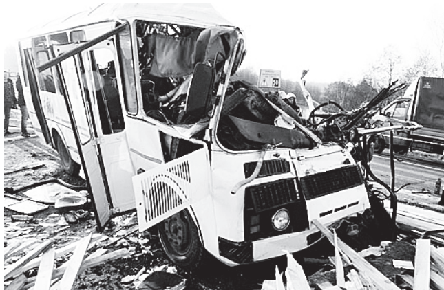
▲ Рухнувший пиломатериал буквально разорвал автобус на части

- Приговором суда обвиняемый признан виновным в совершении преступления, предусмотренного ст.264 ч.5