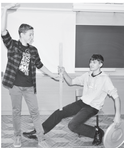
▲ Фото - дно из заданий игры. Гимназисты изображают памятник Минину и Пожарскому