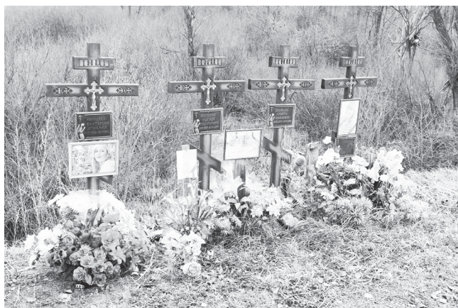
▲ Так место аварии выглядит сейчас

5 ноября исполнился ровно год со дня крупнейшей автомобильной аварии на одной из дорог нашего округа. Известие о ней прогремело практически на всю страну. Тогда в результате страшного ДТП с участием рейсового автобуса и лесовоза погибли 7 человек. Судебные разбирательства продолжались полгода. На скамье подсудимых оказался водитель МАЗа Камиль Нурбагандов. Виновник получил наказание. Вспоминая с болью в сердце то страшное событие, попытаемся понять, все ли возможное сделано сегодня, чтобы подобного не случилось никогда.