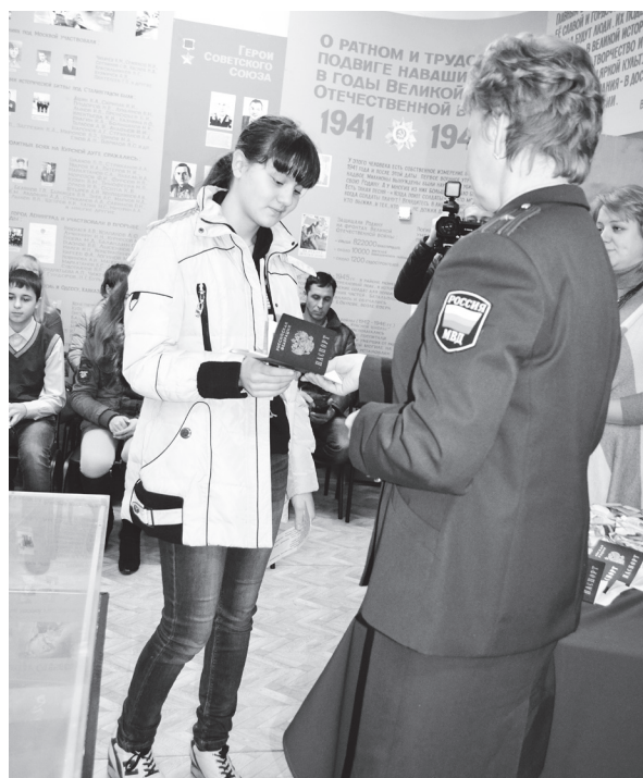
▲ - Будьте достойными гражданами своей страны!

В канун Дня народного единства состоялось торжественное вручение паспортов. Прошло оно в историко-краеведческом музее.