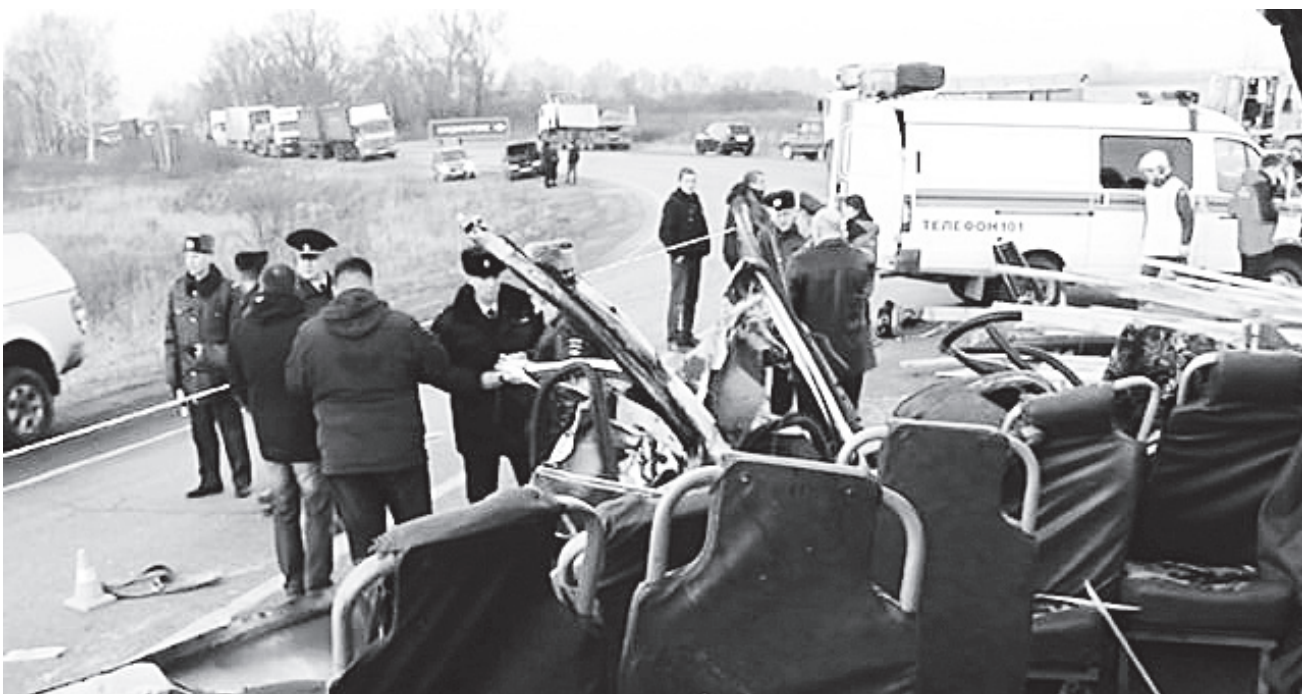
▲ Все силы и средства в тот день были направлены на спасение пострадавших