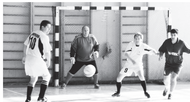
▲ Отличный момент встречи

Игры были очень интересными. Прошли с накалом страстей, сопровождавшихся иногда пере-