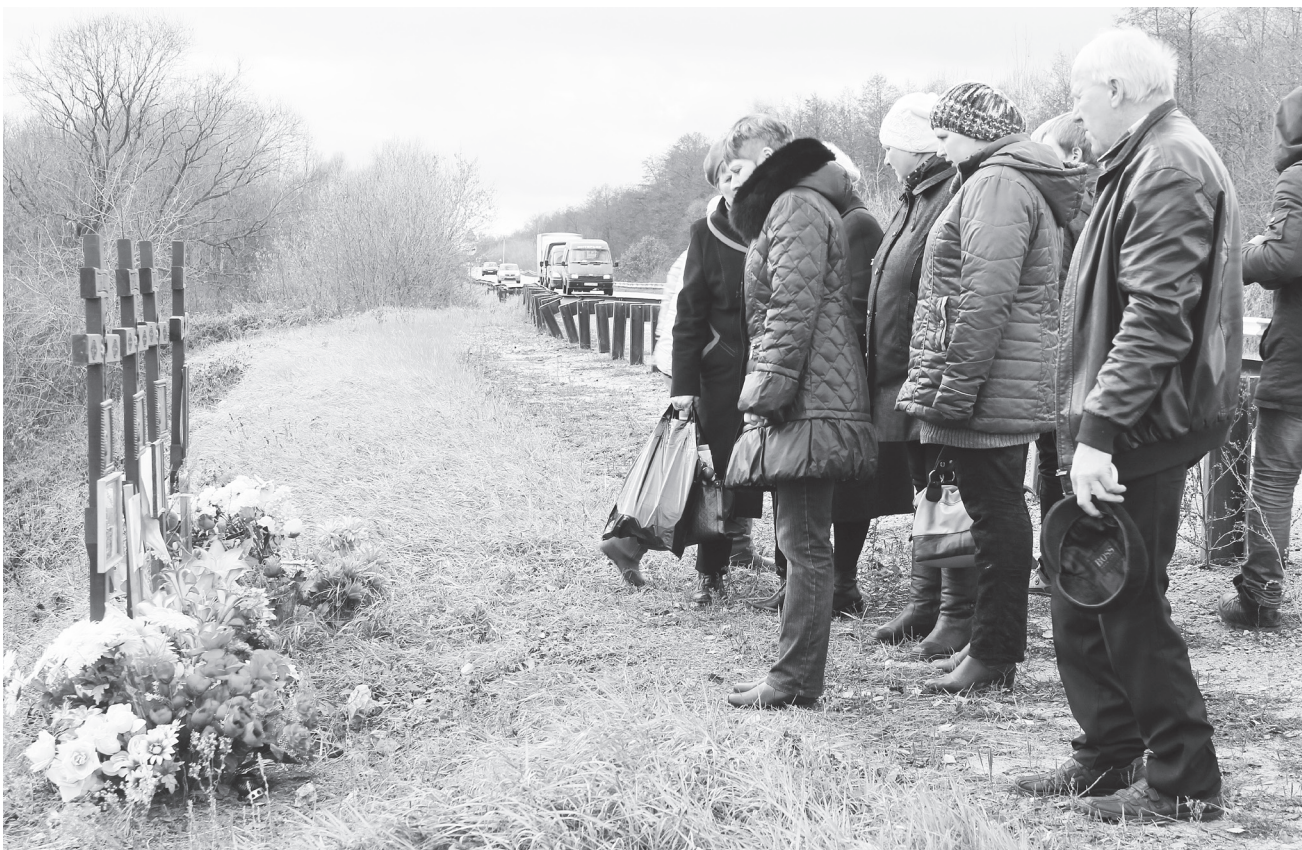
▲ В годовщину ДТП пассажиры автобуса рейса Навашино-Кондраково почтили память погибших земляков