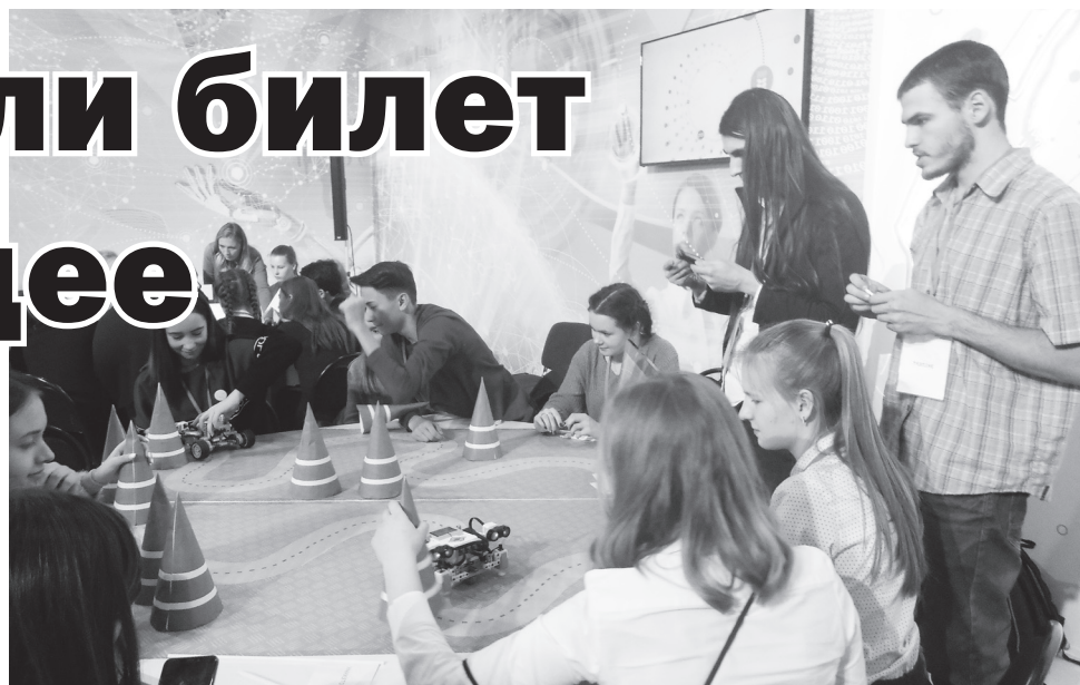
▲ Учащиеся школы №4 на творческой площадке фестиваля

лет. После прохождения всех трех отраслевых зон школьник отмечал в своем билете ту профессиональную пробу, которая максимально отвечала его интересам.