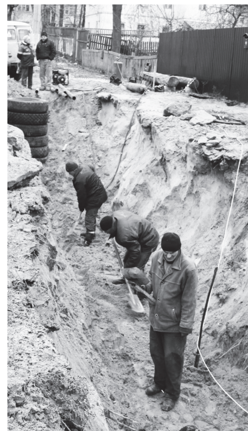
▲ Производится замена водонапорных труб