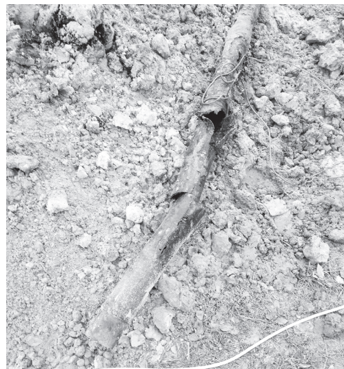
▲ Вот она, ржавая труба, которая была заменена

В редакцию позвонили жильцы домов по улице Московской и пожаловались на отсутствие воды в кранах в течение нескольких дней, просили выяснить причину и уточнить, когда же ее все-таки пустят. Как оказалось, произошла коммунальная авария. Мы тут же выехали по указанному адресу.