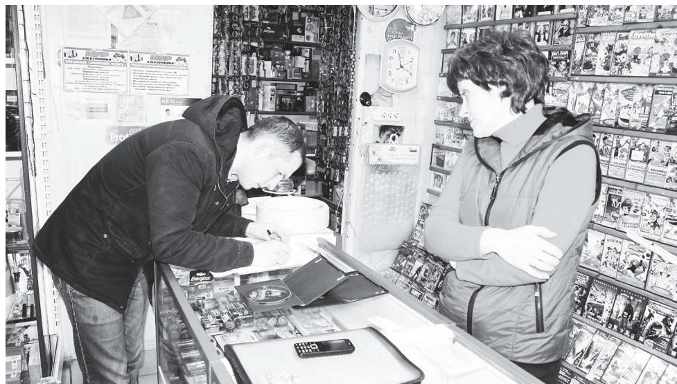
▲ Главный признак подделки - низкая стоимость

На прошлой неделе вместе с оперуполномоченными отдела экономической безопасности и противодействия коррупции Межмуниципального отдела МВД России «Навашинский» мы отправились в рейд с целью выявления контрафактной продукции. Мероприятие было направлено на выявление некачественной продукции именно среди отечественного производителя.