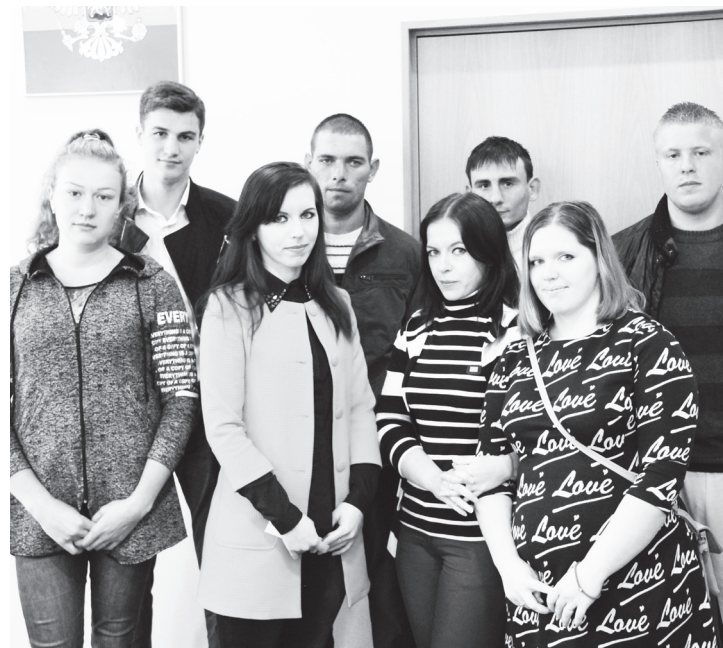
▲ Обладатели квартир

В администрации городского округа Навашинский состоялось распределение квартир для детей-сирот и детей, оставшихся без попечения родителей