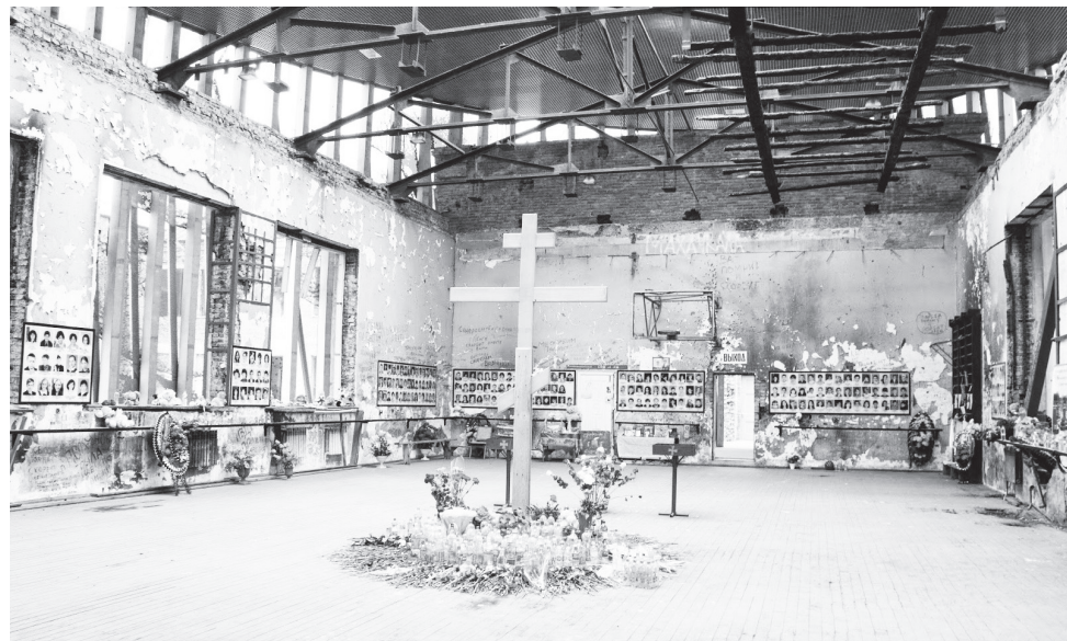
▲ Тот самый спортивный зал, где террористы удерживали заложников

Ответственность за организацию атаки публично взял на себя Шамиль Басаев, опубликовав заявление на сайте чеченских