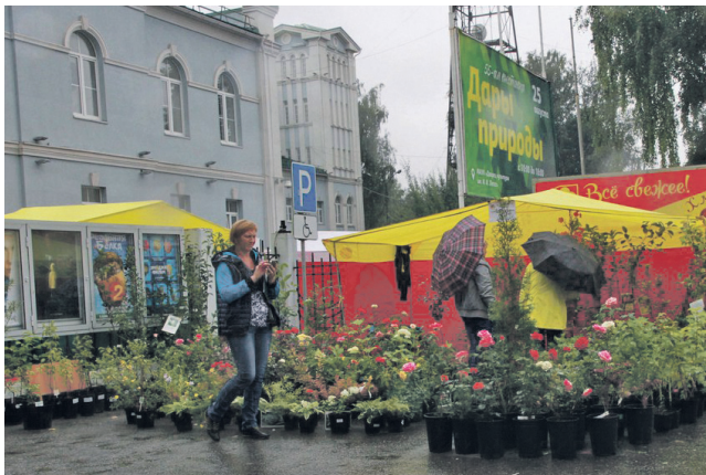
▲ Было изобилие видов цветов представлено на выставке