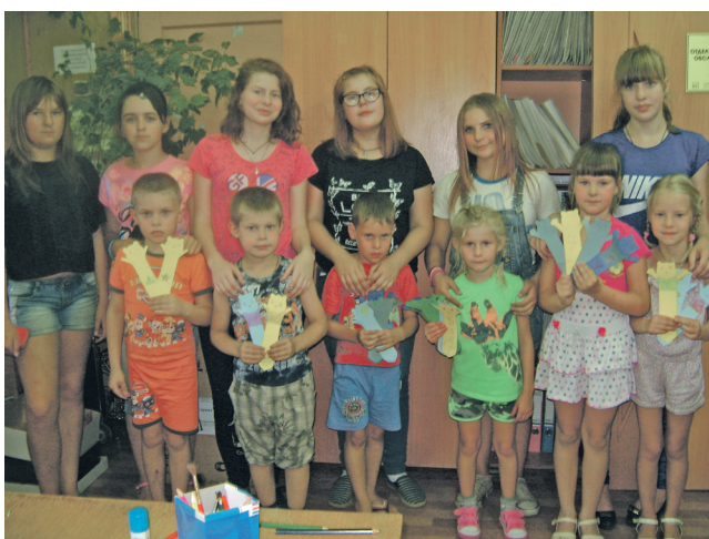
▲ Разноцветные самодельные закладки пригодятся для новых учебников