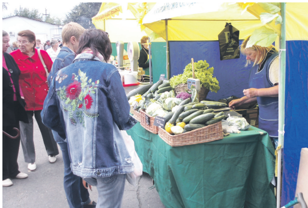
▲ Продукция сельскохозяйственного предприятия ООО «Чудь»