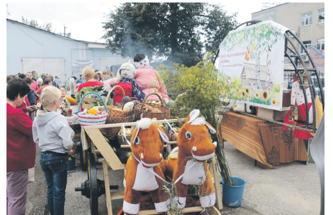
▲ Каждый из участников подошел к оформлению творчески