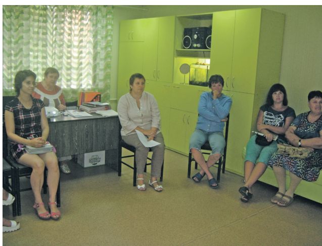
▲ Беседа с родителями будущих первоклассников