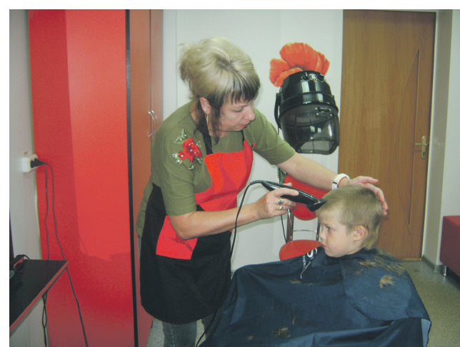
▲ В социальной парикмахерской Комплексного центра