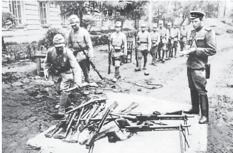
▲ Блестящей победой в Маньчжурии Советский Союз внес решающий вклад в поражение милитаристской Японии

В результате войны ослабла роль Западной Европы в общемировой политике. Главными