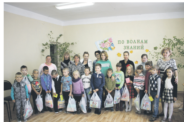
▲ На итоговом мероприятии «По волнам знаний»