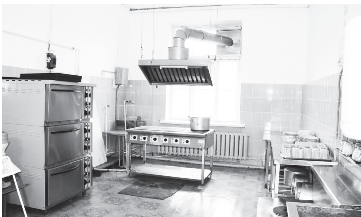
▲ Готовить вкусные обеды для школьников в отремонтированном пищеблоке теперь будет гораздо приятнее