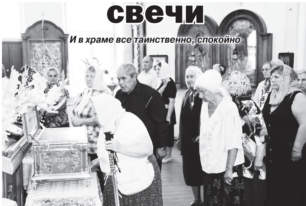
▲ Прихожане Крестовоздвиженского храма приложились к мощам новомучеников российских

иконе обратиться с той или иной просьбой, как важно прийти на исповедь и причастие. Ведь воцерковление каждого человека начинается не только с посещения служб, но и со знания и соблюдения определенных церковных правил, и, что самое важное, с сильной веры. Пусть вы будете знать все молитвы наизусть, читать их целыми днями, но какой в этом толк, если от сердца вашего не исходит искренность. Дело даже не в размере свечей, не в их количестве. Если сердце человека горит любовью к Богу и состраданием к ближнему, то его благоговейное стояние и горячая молитва угоднее Богу, чем самая дорогая свеча, поставленная с холодным сердцем.