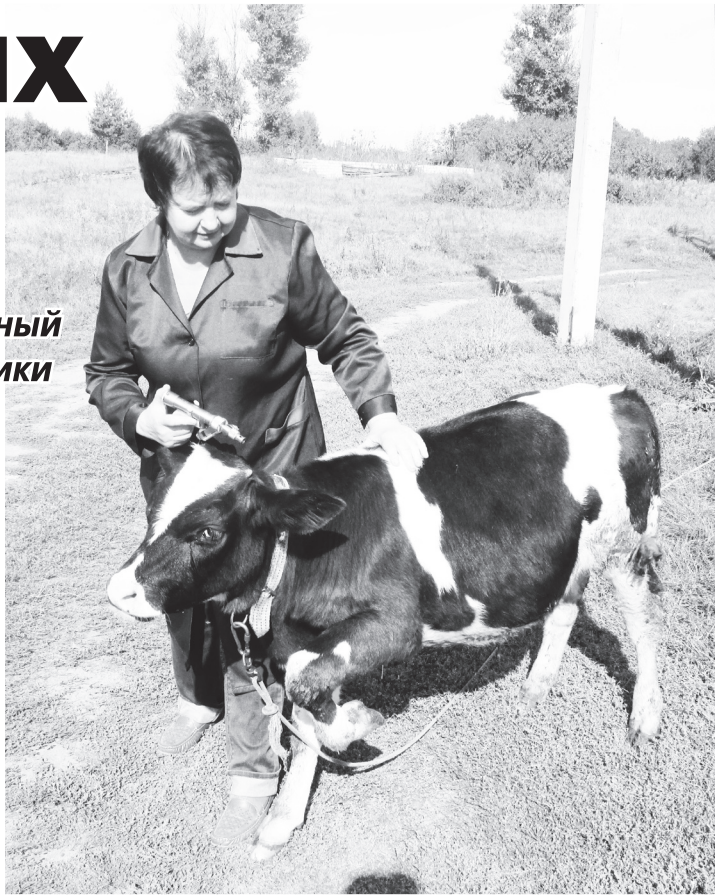
▲ Плановая вакцинация – очень важная часть работы ветеринаров

– В сентябре мы будем проводить плановую обработку крупнорогатого скота от бруцеллеза, сибирской язвы, туберкулеза. Специалисты берут у животных кровь, а потом мы ее отправляем на исследование в Выксу. Что касается африканской чумы свиней, то слу-