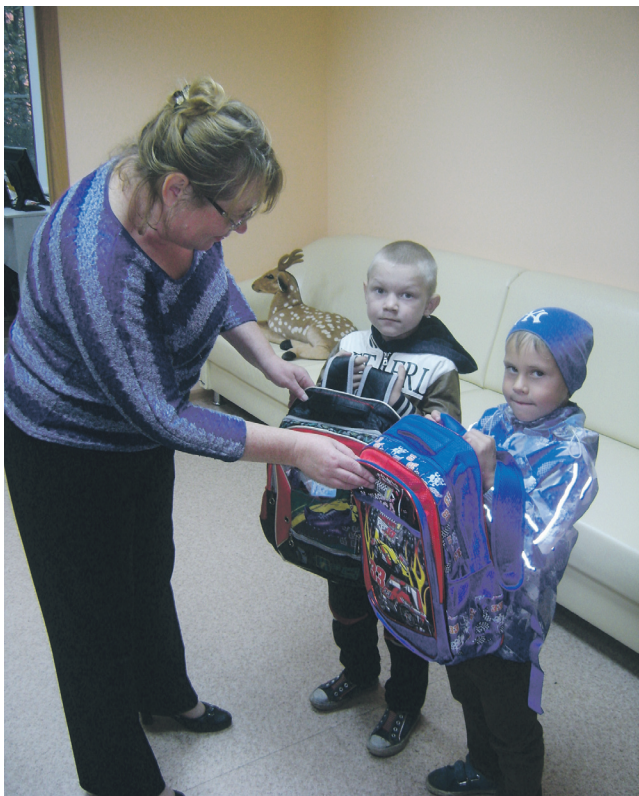
▲ В школу - с новыми ранцами

Такие слова сказал великий русский старец – преподобный Алексей Голосеевский, это значит, что пока мы живы – мы можем помочь ближним. Сотрудники Комплексного центра социального обслуживания населения не просто выполняют свою работу, они подходят к ней с душой, трепетом и добром. В рамках подготовки к новому учебному году и в целях поддержки семей в трудных жизненных ситуациях, дети из которых в этом году пойдут в первый класс, сотрудниками отделения социального обслуживания семьи и детей КЦСОН была проведена благотворительная акция «Скоро в школу!»