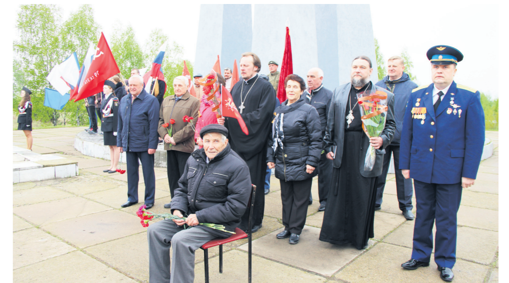
▲ На митинге у обелиска 9 Мая

В 2018 году планируется сохранить вектор направления нашей работы, а также реализовать ряд мероприятий, способствующих развитию округа, таких как: капитальный ремонт Дворца культуры городского округа Навашинский; разработка проектно-сметной документации «Строительство водоза-