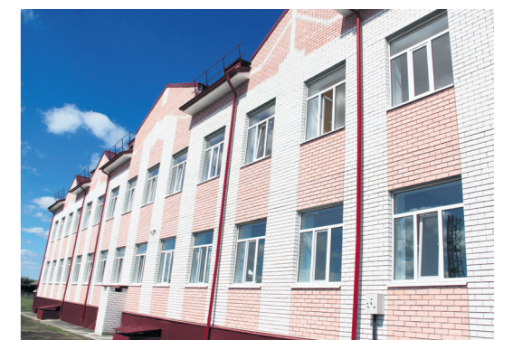
▲ Новая школа в с.Натальино готова к встрече учеников

Решение Совета депутатов об отчете главы местного самоуправления читайте на официальном сайте органов местного самоуправления городского округа Навашинский ( www.navashino.omsk-nnov.ru )