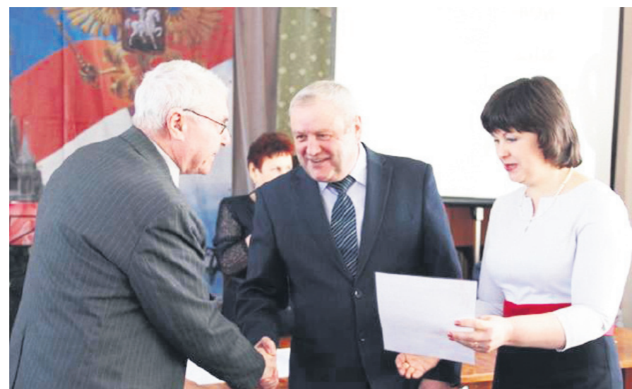
▲ На 30-летию общественной организации ветеранов войны и труда