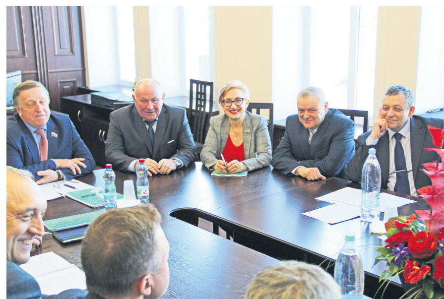
▲ Визит депутата Государственной Думы РФ Натальи Назаровой