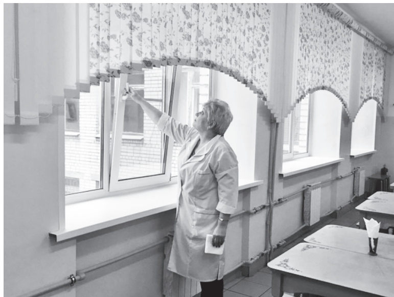
▲ Необходимо регулярно проветривать помещения

родителям не направлять ребенка с признаками респираторных