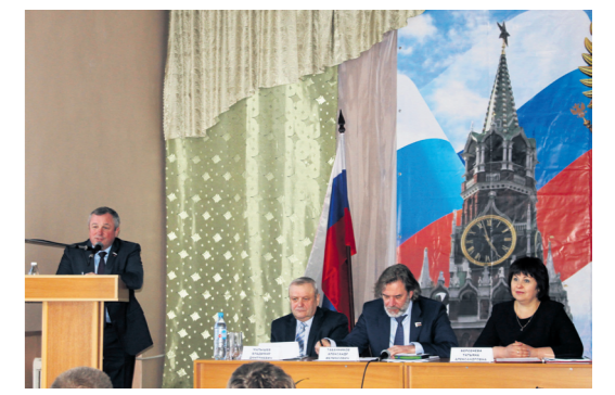
▲ Парламентский день ЗСНО в городском округе Навашинский