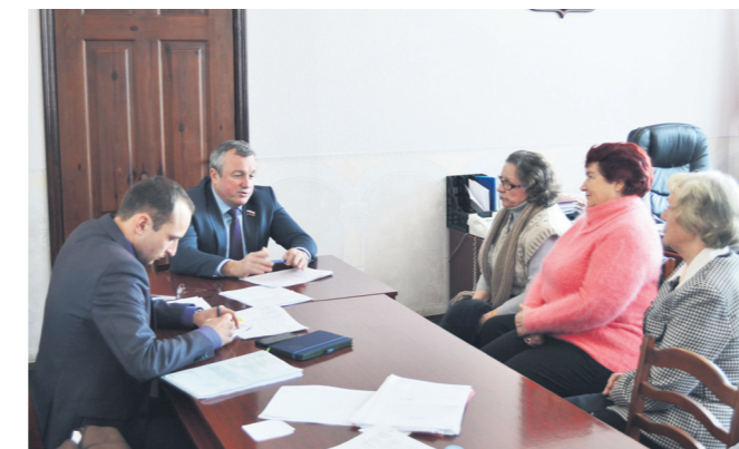
▲ Прием граждан ведет депутат ЗСНО Игорь Турин

На территории городского округа созданы и действуют территориальные советы общественного самоуправления, в заседаниях которых глава местного самоуправления систематически принимает участие.