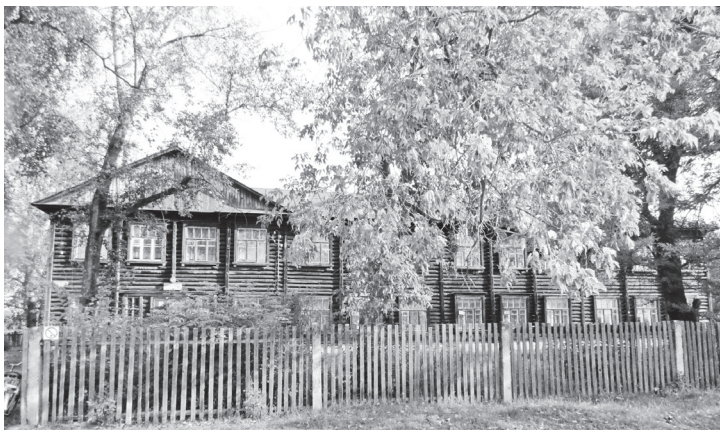
▲ Старое здание Натальинской школы 1952 года постройки