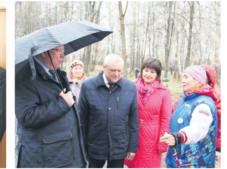
▲ Приезд губернатора В.П.Шанцева