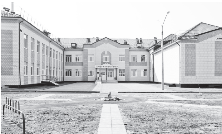
▲ Новое здание соответствует современным стандартам