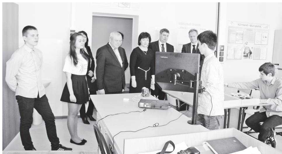
▲ В кабинете физики. «Опыт – сын ошибок трудных»

В этом смысле натальинцам повезло. Но ждали они этого везения долгое время.