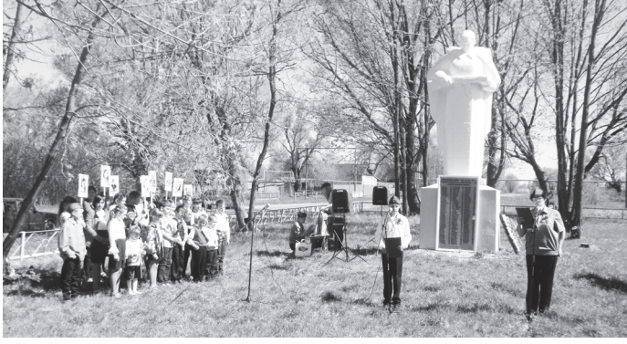
▲ Митинг в Ефанове