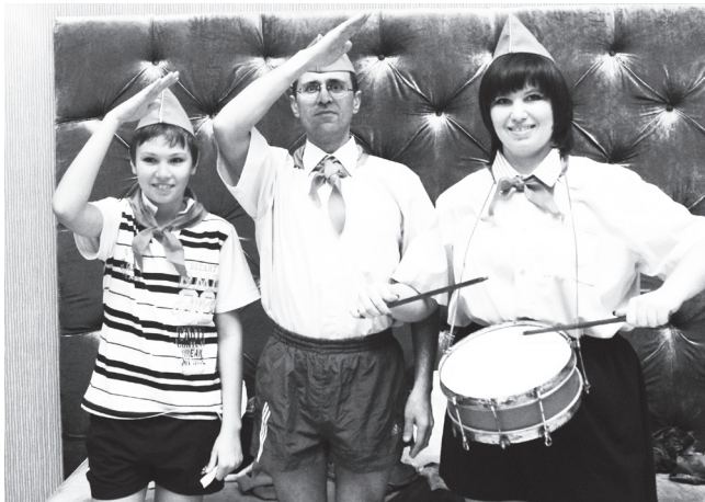
▲ Юбилей главы семейства