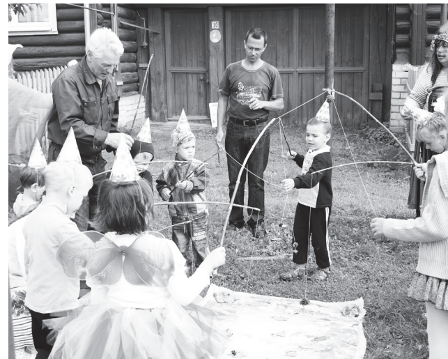
▲ День рождения Таи