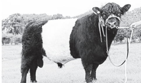
▲ Бык галловейской породы

На официальной странице ТК «Навашинское время» в социальной сети жительница района поместила сообщение с просьбой разобраться в ситуации. А она вот в чем заключается: