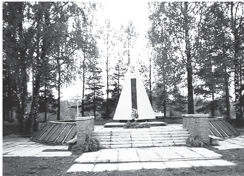
▲ Около деревни Демяхи Бельского района Тверской области

Александр БАКУЛИН Фото предоставлено автором