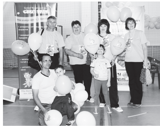
▲ Участвуя в областном конкурсе «Лучший папа»