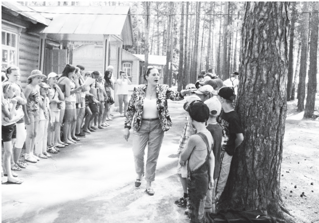
▲ Как и в прошлом году, для детей будет организован безопасный отдых

Ольга СОЛОВЬЕВА.