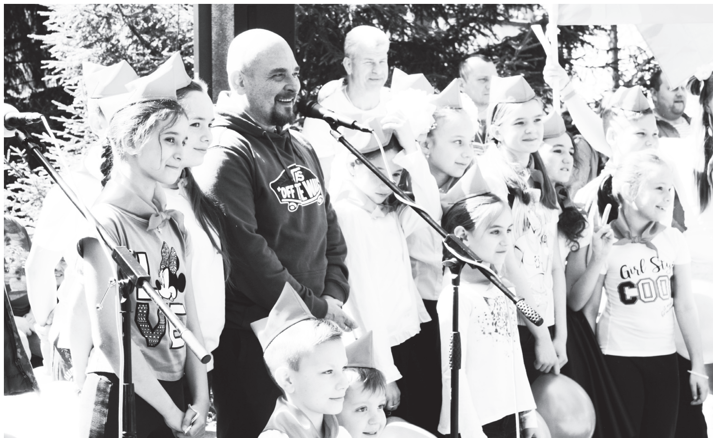
▲ Праздничная демонстрация «В лучших традициях». В ней, наряду со взрослыми, участвовали дети, отдыхающие в туристическом комплексе