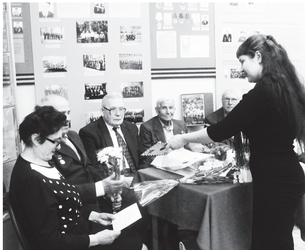
▲ Вручение писем от воспитанников детского сада № 7 «Елочка»