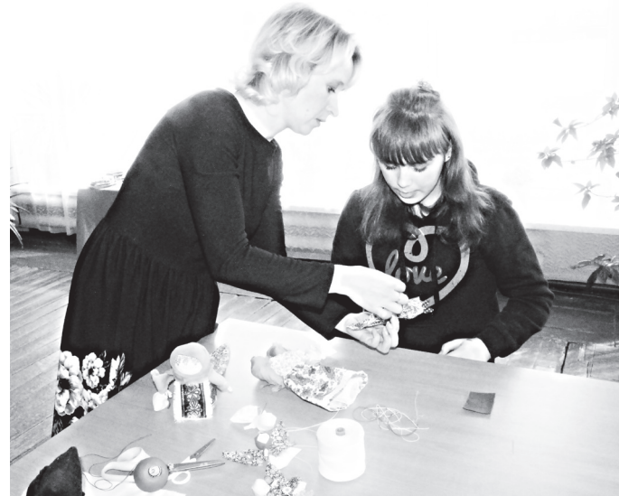
▲ Мастер-класс по изготовлению ангелочков