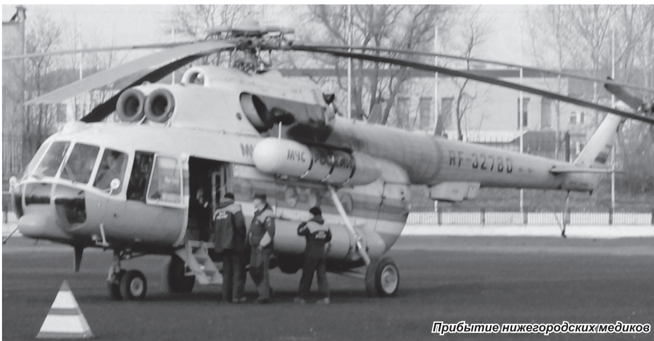
Прибытие нижегородских медиков

Земское собрание, Администрация Навашиинского района и все навашиинцы выражают глубокое соболезнование родным и близким погибших в дорожно-транспортном происшествии 5 ноября 2014 года.