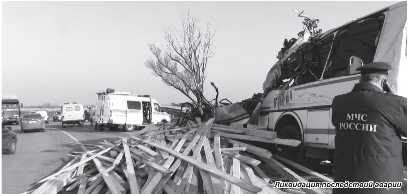
Ликвидация последствий аварии

В результате столкновения был поврежден левый борт МАЗа, и произошло падение перевозимого груза на автобус. По словам водителя, вес груза составлял 21 тонну, но в процессе расследования будет известна точная цифра и по объему, и по весу перевозимого груза. Весь пилотматериал был изъят, перегружен на лесовозы и доставлен на территорию нашего отдела. В настоящее время следователями возбуждено уголовное дело и передано для дальнейшего расследования в Межрайонный следственный отдел города Выкса. Водитель МАЗа оказался жителем Дагестана, и сейчас он находится в изо-