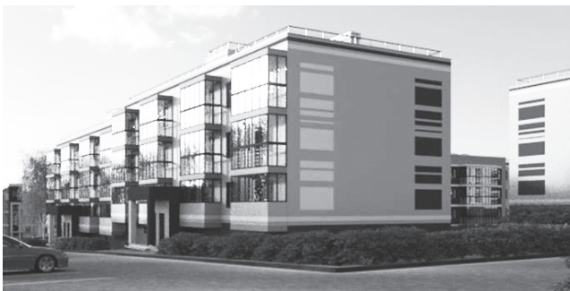
▲ Визуализация первого этапа проекта «Окский берег», Богородский район

В рамках реализации программы на территории Нижегородской области цена за 1 квадратный метр жилья не будет превышать 35 тысяч рублей, а банки, участвующие в программе, начнут осуществлять ипотечное кредитование под льготные 12,84% процента годовых. К сожалению, на данный момент, строительство доступного