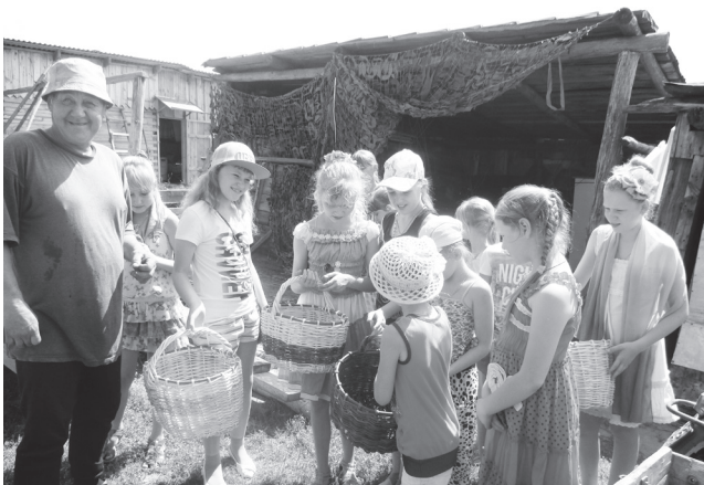
▲ Пробовали плести корзины