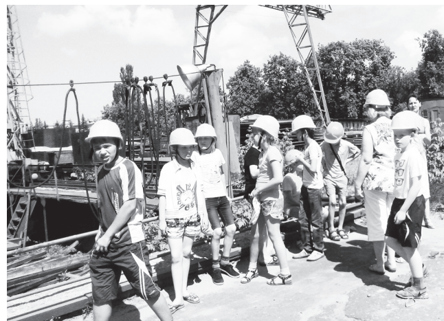
▲ Экскурсия на ОАО «Окская судостроительная»

Экскурсии, встречи с интересными людьми, игры-путешествия, сбалансированное питание - все это удивительное лето, подаренное детям взрослыми людьми: сотрудниками нашего учреждения, учителями и поварами гимназии, социальными партнерами - управлениями об-