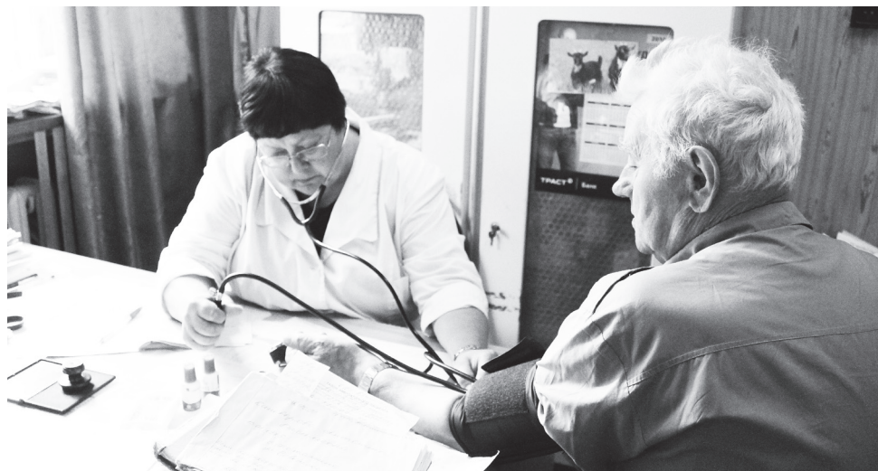
▲ Диспансеризацию можно пройти бесплатно в медицинском учреждении по месту жительства