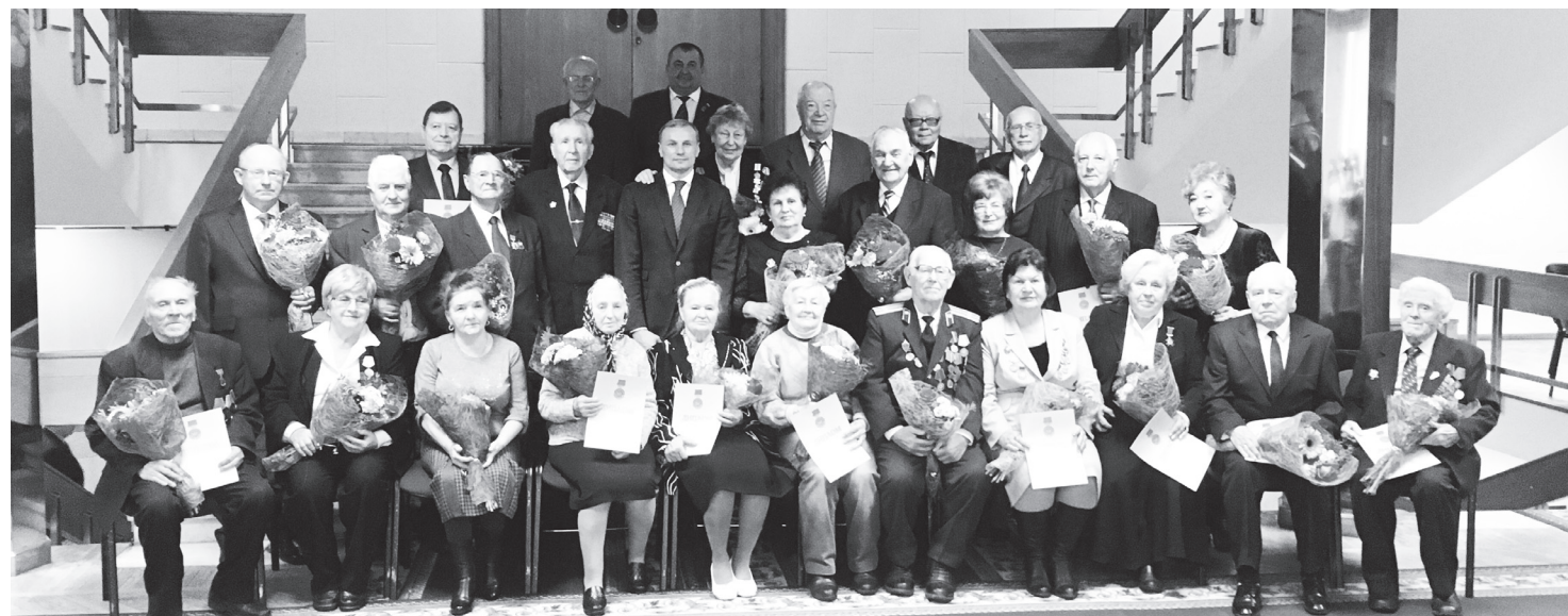
▲ На торжественной церемонии

Звание «Заслуженный ветеран Нижегородской области» присваивается с 2005 года за личные заслуги и высокие результаты, достигнутые ветеранами в период после выхода на пенсию в различных сферах трудовой деятельности, за большой вклад в развитие ветеранского движения. За весь период, вплоть до настоящего момента, это звание получили 789 ветеранов. И в этом списке 16 навашинцев.