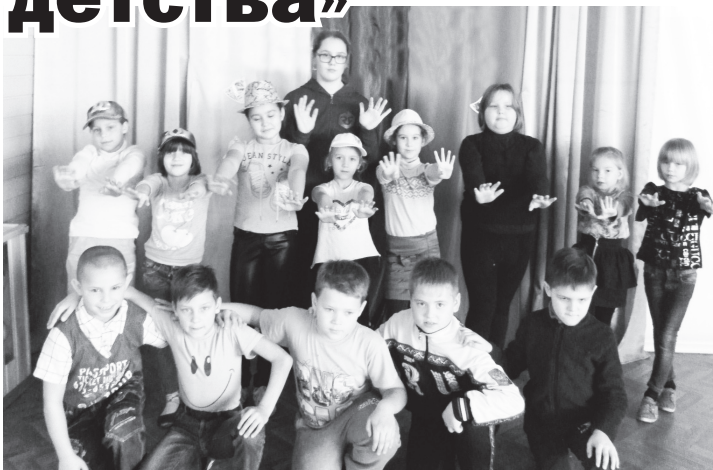
▲ Воспитанники пришкольного лагеря

Анастасия ШВЫНДОВА Фото предоставлено автором