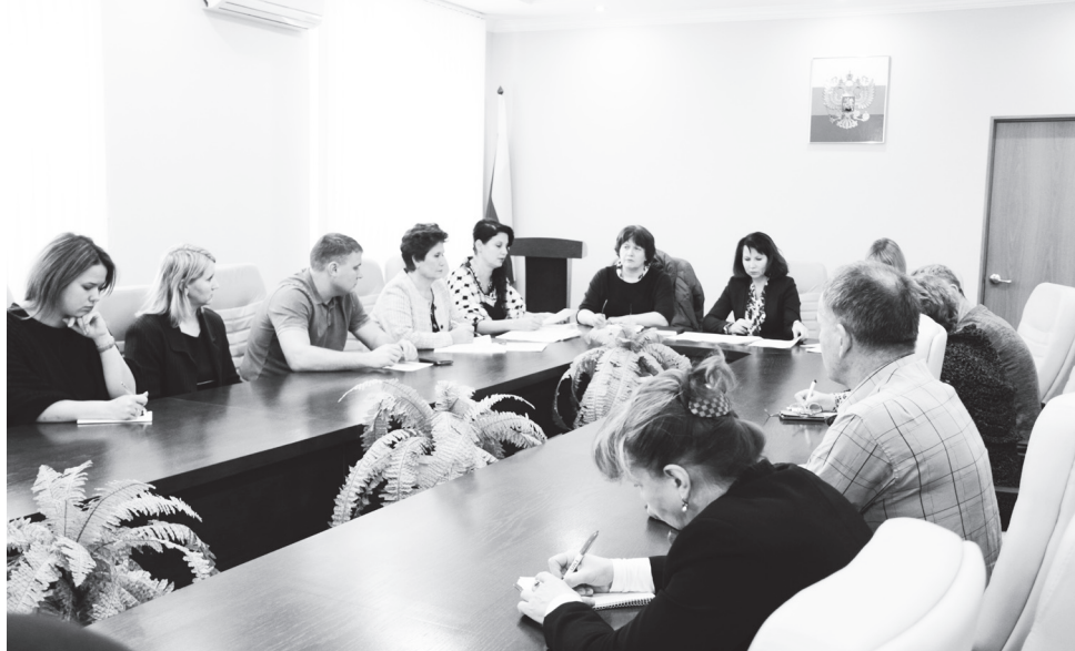
▲ С рабочим визитом в городском округе Навашинский побывали представители государственной жилищной инспекции Нижегородской области

— Такие совещания проводятся повсеместно в муниципальных районах области. В этом году по 1 ноября в жилищную инспекцию поступило 86 обращений граждан по городскому округу Навашинский. Это на 11% больше, чем за соответствующий период прошлого года. Это говорит о том, что вырос уровень компетенции жилищной инспекции, мы стали заниматься более расширенными вопросами. По итогам работы за 9 месяцев 2017 года проведено