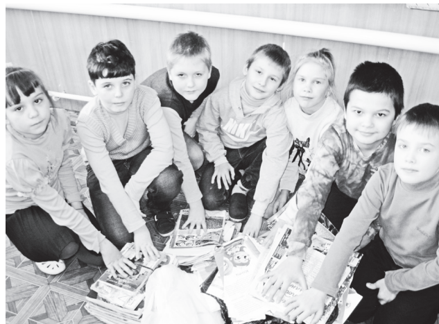
▲ Спасаем деревья все вместе

В городском округе проведен эко-марафон Переработка «Сдай макулатуру – спаси дерево!» Его основная задача – привлечение внимания граждан к ресурсосбережению, внесение вклада в развитие вторичной переработки отходов.