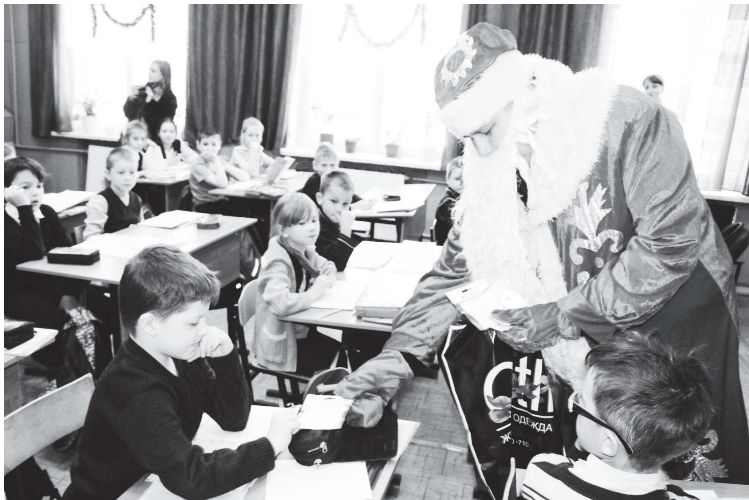
▲ Подарки Деда Мороза помогут ребятам быть заметнее на дороге

Сотрудники МО МВД России «Навашинский» поддержали Всероссийскую акцию «Полицейский Дед Мороз»