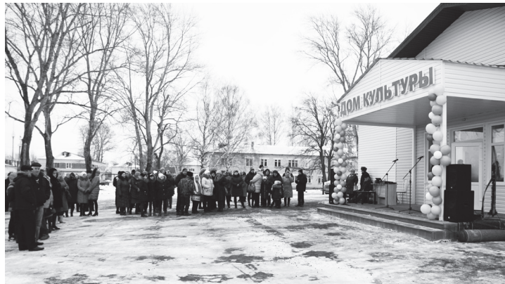
▲ ДК Сеченово

Всего за 4 месяца пустырь превращается, превращается... в настоящий дом культуры: это не эпизод из фантастического фильма, а работа программы по строительству модульных ДК в Нижегородской области. Буквально на днях такое здание открыли в селе Верхнее Талызино Сеченовского района. Там есть и народный хор, и детский фольклорный ансамбль, а вот Дома культуры не было. Как рассказали жители, семь лет назад здание сгорело и народным коллективам