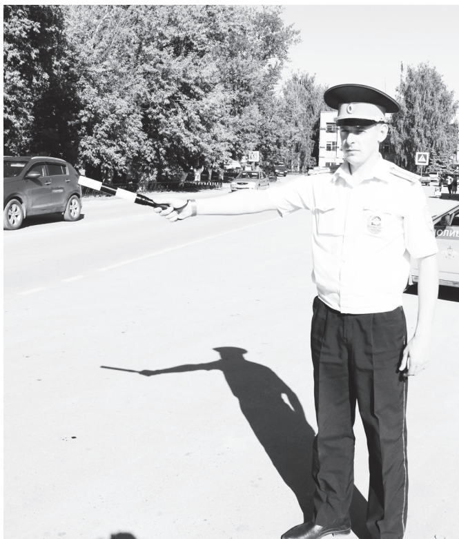
▲ Контролировать ситуацию на дороге - задача важная и необходимая