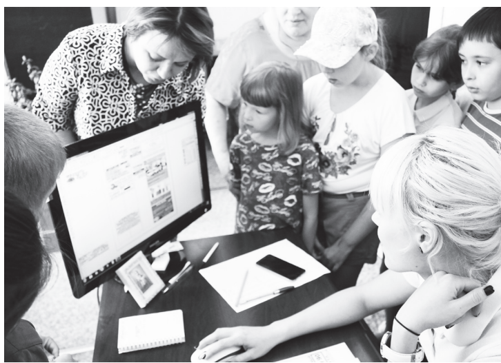
▲ Работа дизайнера увлекательна, но требует большого внимания

Именно под таким названием стартовал проект, в рамках которого ребята из начальных классов школ округа могут весело, интересно и активно провести каникулы, при этом, как говорится, без «материальных вложений».