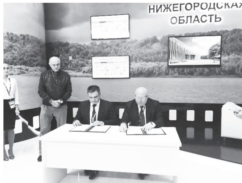
▲ По данным Нижегородстата, с 2005 года объем инвестиций, привлекаемых ежегодно в Нижегородскую область, вырос в целом почти в 4 раза и по итогам 2015 года составил 229 млрд рублей

Инвесторы, которые когда-то пришли вести бизнес в Нижегородской области, признаются – о своем решении не жалеют.