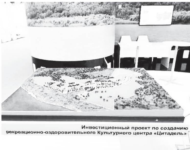
Инвестиционный проект по созданию рекреационно-оздоровительного Культурного центра «Цитадель»

Инна МИРОНОВА