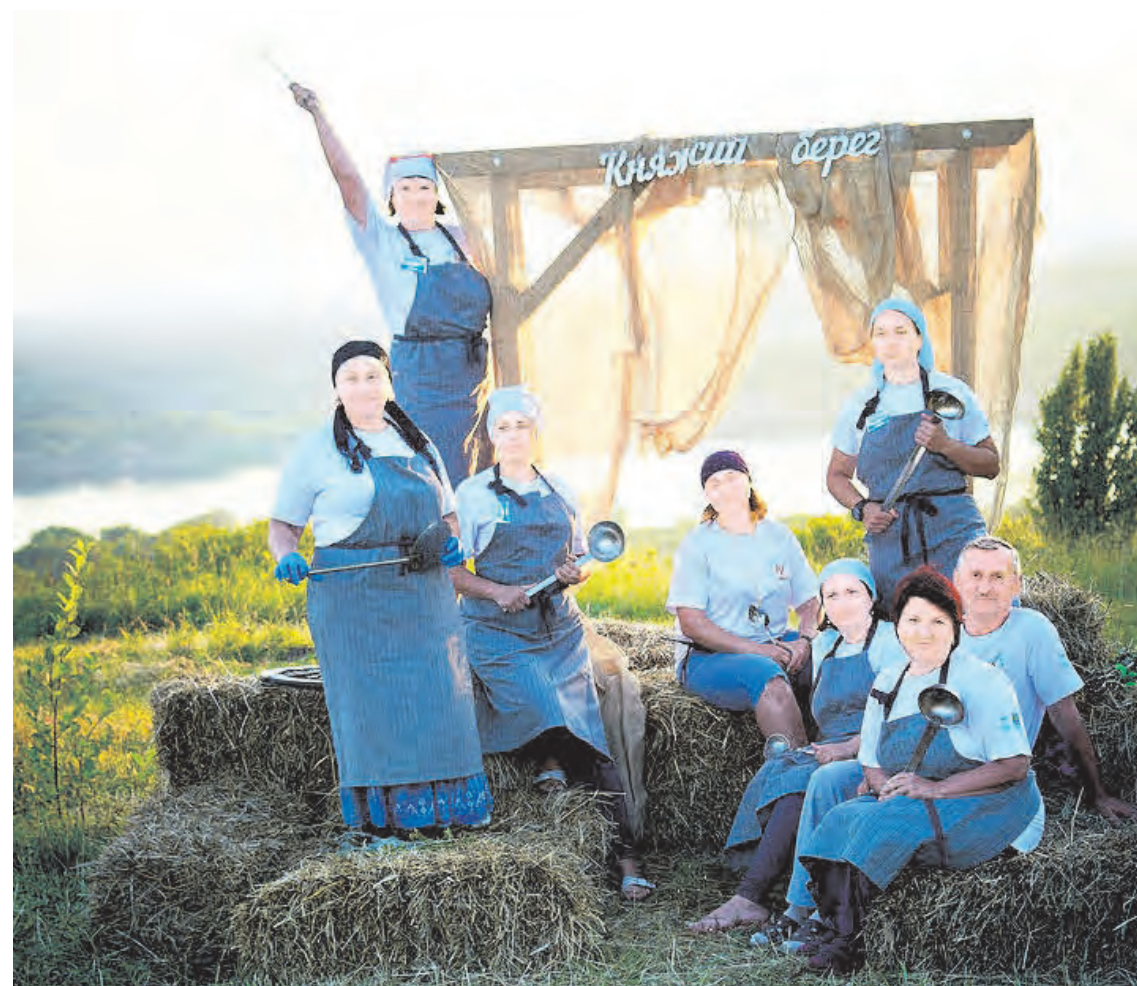
▲ На Княжем берегу наши волонтеры отвечали за кухню, готовили обед для участников фестиваля

Кстати, раз уж разговор зашел о свободном времени, то, уточню, у волонтеров и оно не бывает праздным. Они умеют отдыхать с пользой и для ума, и для души, и для тела. В их семейных фотоальбомах бережно хранятся снимки, сделанные ими в туристических, байдарочных, паломнических походах, велопробегах, военно-