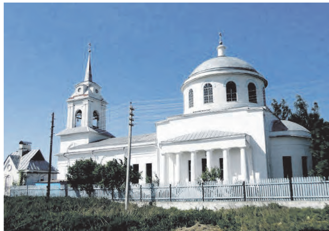
▲ Крестовоздвиженский храм с. Б. Окулово