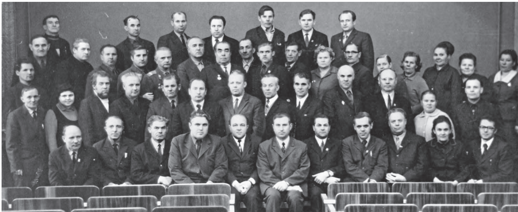
Члены Навашинского РК КПСС, снимок 1971 г.