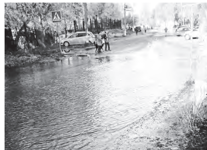
▲ В день аварии горожане с трудом находили пути обхода