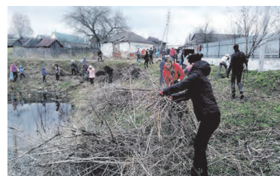
▲ В Б. Окулово. Наводили порядок на территории, прилегающей к церкви

патриотических играх, лыжных прогулках. Все это их объединяет не меньше, чем общие дела, оставляя в памяти не менее яркие воспоминания, которыми они охотно делятся с другими и,