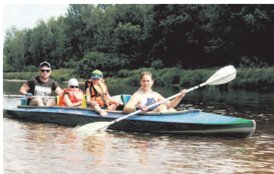
▲ В байдарочных походах