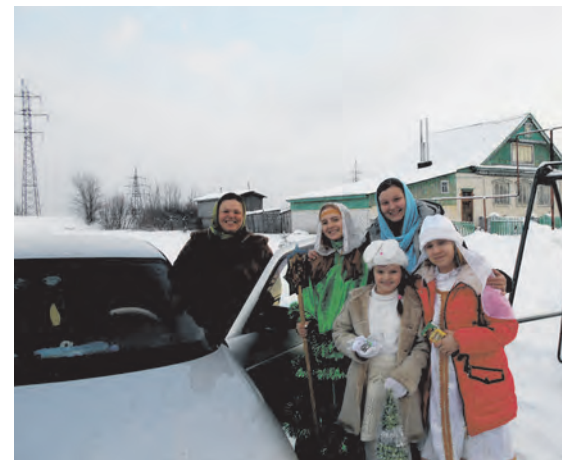
▲ С подарками к детям-инвалидам

Как аксиома: одна тысяча рублей в месяц может сделать комфортной жизнь парализованного инвалида, один визит в неделю к одинокому старику избавит его от одиночества, один час в неделю, проведенный с малышом из Дома малютки, поможет ему нормально развиваться, старое пальто, отданное бездомному, поможет ему не замерзнуть.