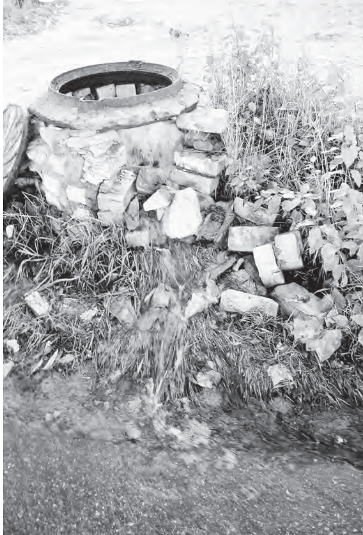
▲ Вода была с такой силой, что разрушила колодезную кирпичную кладку

Прошедшая рабочая неделя ознаменовалась двумя коммунальными происшествиями.