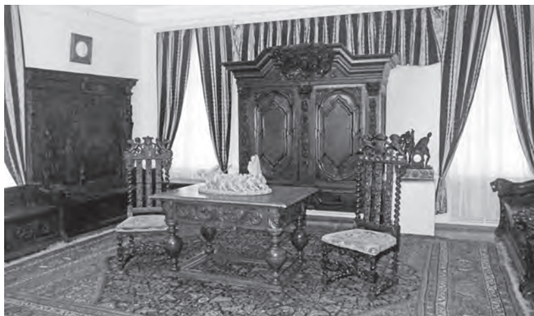
▲ Из имения Уваровых немецкий дубовый гарнитур. XVIII век