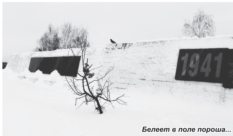
Белеет в поле пороша...

«Мемориал «Три штыка», что в Калининском микрорайоне Навашина, находится в удручающем состоянии, он заброшен, никто не следит за ним. А территория вокруг него, словно проходной двор, заросший бурьяном с проложенными в нем тропами и зимой, и летом. Снег в мемориале техникой сгребают в огромные кучи к стеле с именами погибших воинов. Чаше площадь мемориала вообще не очищается. Жители ближайших пятиэтажек выгуливают в мемориале собак и выбивают на снегу ковровые дорожки. Вызывает недоумение «Триумфальная арка» воздушной магистрали газопровода, которая венчает вход в мемориал. Неужели ее нельзя было в этом месте проложить под землей? Украшением возле мемориала стали контейнеры для бытовых отходов, из которых порывы ветра несут к памятнику «бывшую в бою» туалетную бумагу и прочий мусор. Вечный огонь не горит, его зажигают 9 Мая. После ритуала из клятв и обещаний у облезлых