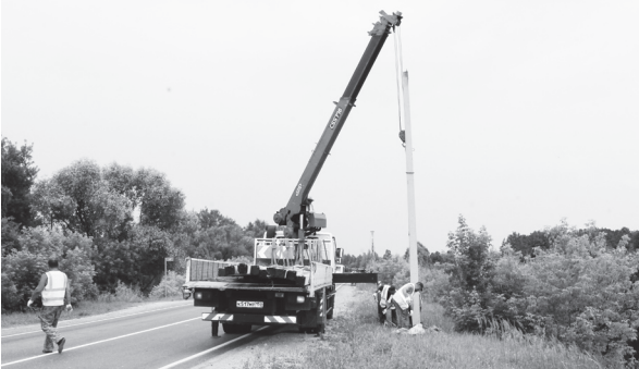
▲ В Позднякове ведутся работы по устройству наружного освещения

Подрядчики планируют до конца текущего года выполнить работы по устройству более 15 км линий наружного освещения на региональных дорогах. Об этом сообщает Главное управление автомобильных дорог Нижегородской области.