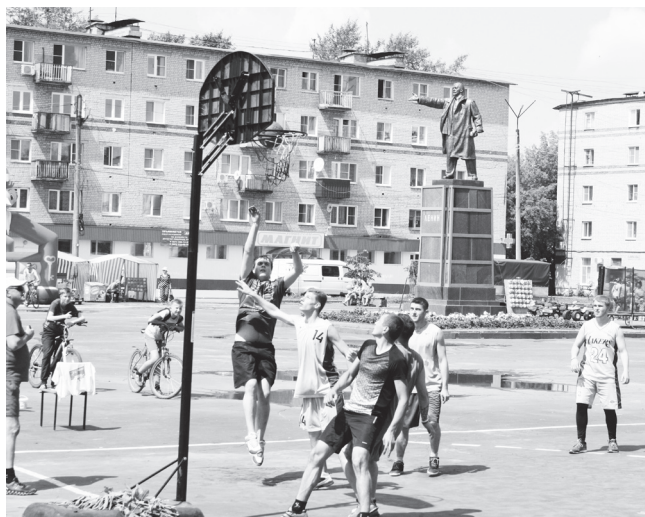
▲ Один за всех и все за одного - девиз команд, участвовавших в турнире по стритболу

Праздник начался по – спортивному – с молодежного фестиваля под названием «Спорт – моя тема», который организовали и провели сотрудники управления культуры, спорта и молодежной политики округа. Несмотря на жаркую, душную погоду, в половине двенадцатого, после регистрации и получения нагрудных номерков, а также выполнения легкой зарядки, все желающие приняли участие в массовом велопробеге. Десятки навашинец проехали по центральному улицам города: Ленина, 50 лет Октября, Калинина, Лепсе, Пионерской и переулку Дзержинского. Совершив круг, велосипедисты вновь вернулись туда, откуда стартовали, - на центральную площадь. Более юные велюлюбители, хоть и остались довольны этим мероприятием, все же сказали, что дистанция была маловата.