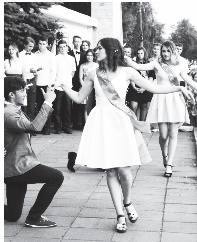
▲ В школьном вальсе кружась...