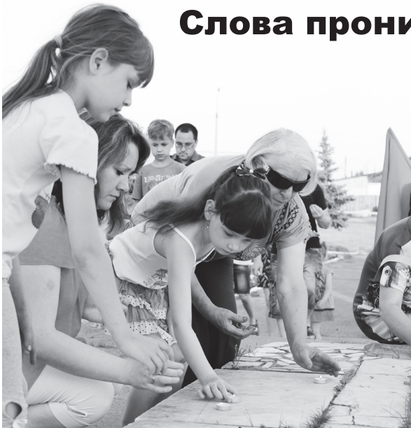
▲ В огне свечи - частичка сердца

22 июня, ровно 75 лет назад, началась Великая Отечественная война. 1418 дней, проведенных в боях и сражениях, обернулись большой потерей. Погибло около 27 миллионов со-