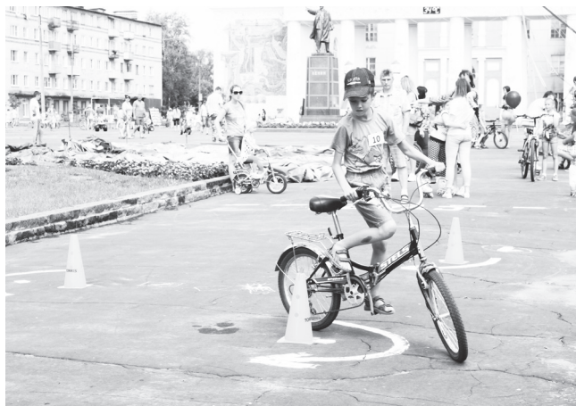
▲ Соревнования «Kinds cross» в разгаре. Главное - не потерять равновесия и побыстрее добраться до финиша

В воскресенье, 26 июня, в Навашине прошли многочисленные мероприятия, приуроченные к празднованию Дня молодежи.