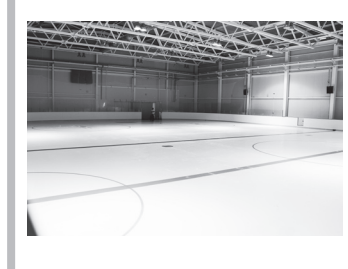
🛦 Заливка льда завершена

В Навашинском дворце в минувшие выходные завершили заливку льда.