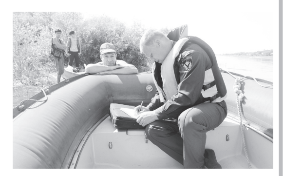
▲ Очередной рейд сотрудников ГИМС

С начала периода навигации на водных объектах инспекторами ГИМС по Навашинскому участку было проведено 47 патрулирований, из которых 7 - в июле. В ходе этих мероприятий инспекторами ГИМС было наложено 61 административное наказание на нарушителей, за аналогичный период прошлого года их насчитывалось 52. Увеличение числа нарушений связано с большим количеством любителей рыбной ловли. Сумма наложенных штрафов за весь период составляет 16200 руб., из них за июль - 9100 руб.