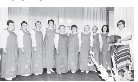
▲ Вокальный коллектив «Валтовчанки» на сцене Валтовского СДК

Название «Когда мы вместе - это песня», которое придумали «Валтовчанки» по случаю празднования юбилея, полностью соответствует