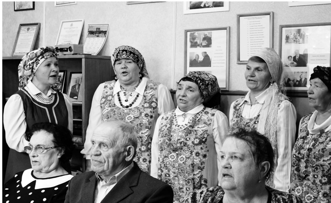
▲ Коллектив «Лучинушка» с песней о России