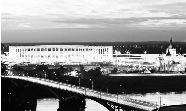
▲ Вид на стадион со стороны Оки

В 1817 году из города Макарьева на левый берег Оки была перенесена крупнейшая в России ярмарка, благодаря которой началось быстрое экономическое развитие города и прилегающих к нему поселений. Благодаря ярмарке Нижний Новгород получил прозвище «Карман России».