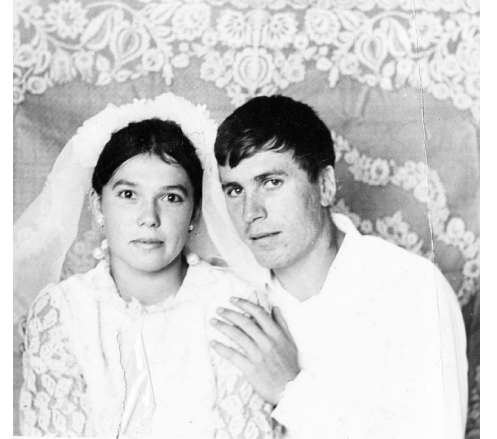
▲ Мамочка в белой фате, счастливая и радостная, папа смущенный и скромный

В маме меня восхищали безумная тяга к жизни, энтузиазм, умение видеть во всем