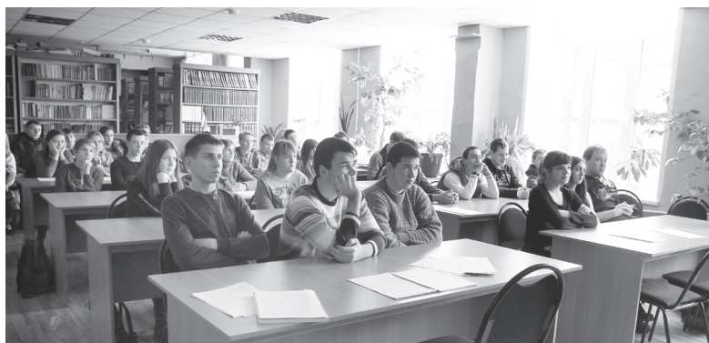
▲ Студенты во время урока