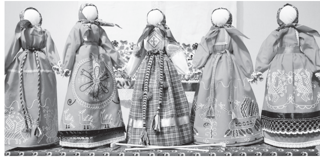
▲ Куклы в национальных костюмах северных народов России