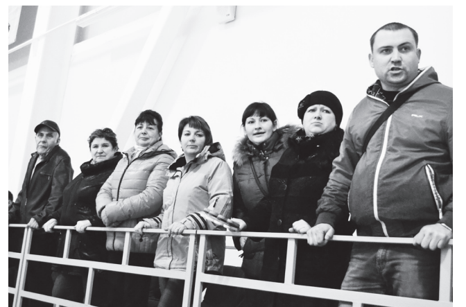
▲ В рядах болельщиков - волнение