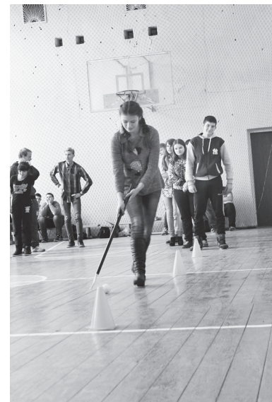
▲ В эстафете участвовали активно