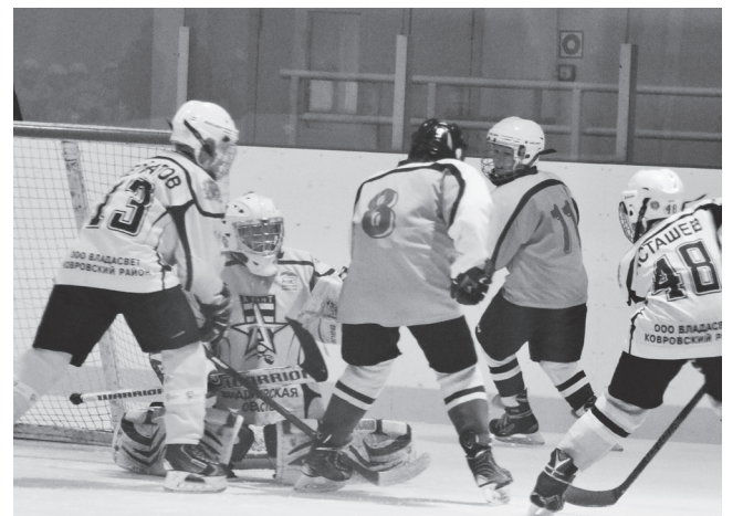
▲ Атакуя ворота противника