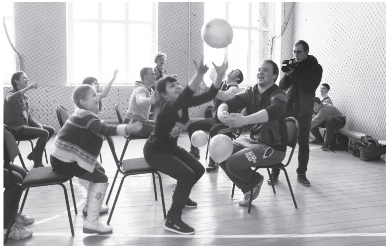
▲ Шумно, весело! Участникам понравилось