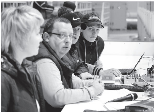
▲ За столом комментатора

В Ледовом дворце «Флагман» состоялась вторая игра с участием навашинской хоккейной команды «Ока» в рамках первенства Нижегородской области среди подростков 2003-2004 г.р. Матч был жарким. Соперники - команда из Коврова Владимирской области «33 Легион». Наши игроки, как и в первой игре с нижегородской командой «Восток 2», закончившейся со счетом 19:2 в пользу команды «Ока» Навашино, выглядели настоящими бойцами.