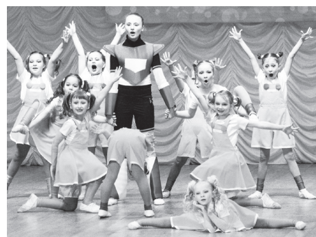
▲ Хореографический ансамбль «Экспрессио»

- На фестиваль-конкурс мы представили от каждого коллектива по 2 танца: «Непослушный оркестр» и «Куклин дом», «Босоногий дождь» и «О чем мне пишут облака». Победа в одной из номинаций среди участников своей возрастной группы стала для всех нас радостным и памятным событием, - рассказы-