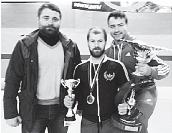
▲ Наши на пьедестале

Участвовало в нем 13 команд. Вторую ступень заняли спортсмены из Кулебак, на третьем месте расположилась команда Заволжья.