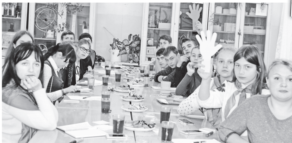
▲ Разговор шел за чаем, в непринужденной обстановке. И это сплотило подростков во время выполнения творческих заданий

Это название носят волонтеры школы № 3. Программа их деятельности состоит из 4-х модулей: «Разожги огонь добра в себе», «Здоровым быть здорово!», «Рука помощи», «Твори, выдумывай, пробуй». Работа с малышами, помощь ветеранам, спортивные мероприятия – соревнования, игры, а также праздники, концерты – все это формы их работы.