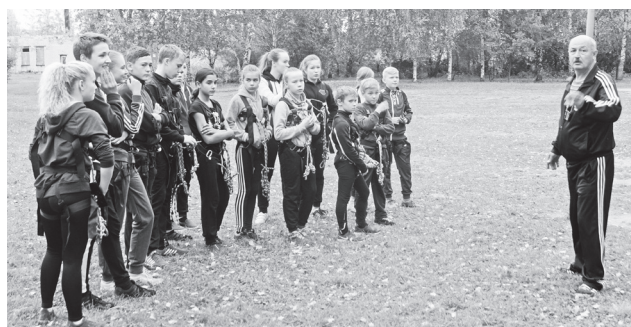
▲ Команда Поздняковской школы