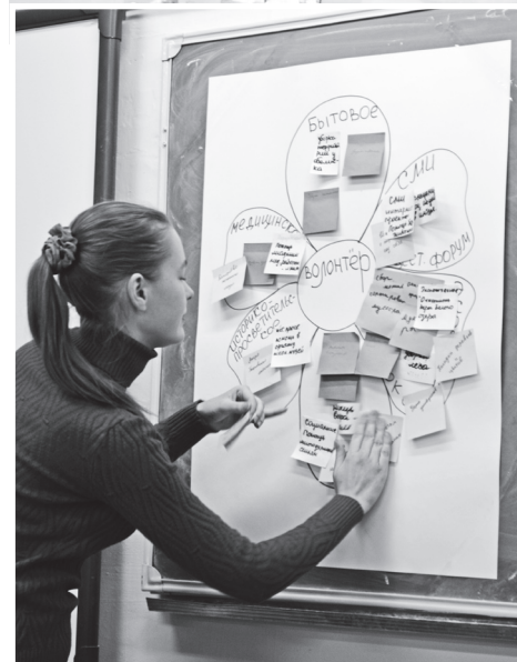
▲ Ромашка молодежных дел по различным направлениям

за порядком у обелиска Славы и вообще безразличны к экологии родного края. А еще они активно пропагандируют здоровый образ жизни среди населения, готовы прийти на помощь всем, кто в ней нуждается.