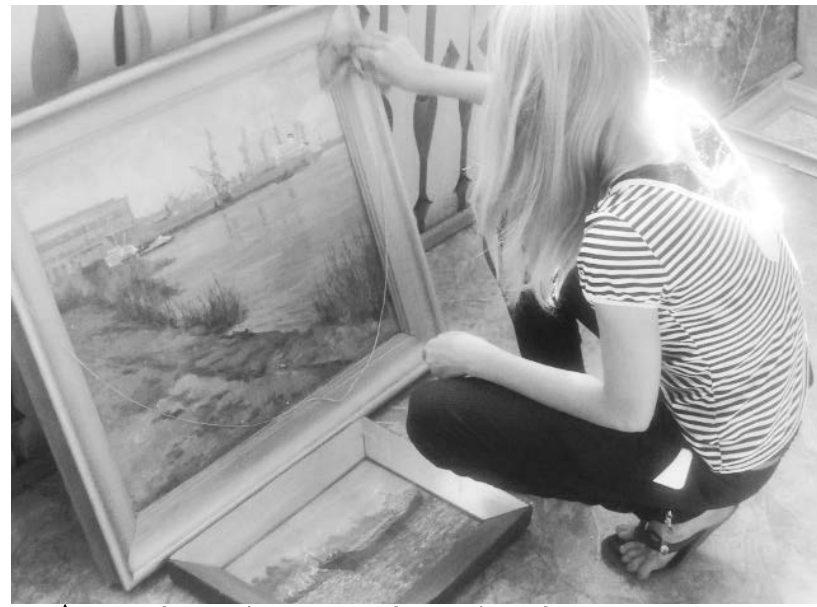
▲ Ежегодно ребята из трудовой бригады снимают картины, очищают их от пыли, делают мелкий ремонт рам