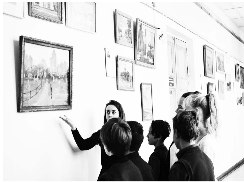
▲ Во время экскурсий по музею представители детского объединения «Энергия будущего» предлагают экскурсантам посмотреть картины