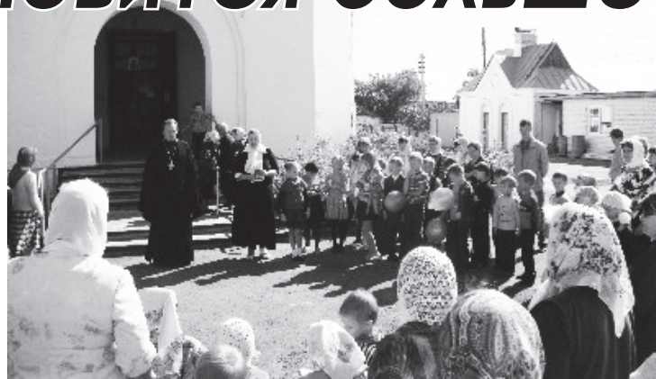
▲ 1 сентября в Воскресной школе

учатся церковному пению. Первоклассники познают храмование, на котором им рассказывают о внешнем устройстве храма, что такое свечи, колокола... Во 2 классе дети изучают дисциплину, которая называется иконостас. Они знакомятся с языком иконы. Икона заключает в себе целое Богословие. Даже цвет ее может о ней рассказать многое. Знакомятся с православными праздниками. В 3-м классе изучают Ветхий Завет, в 4-5 классах - Новый Завет. В 6 классе - Катехизис. Есть и дополнительные предметы: литургия, где дети изучают Богослужение, что такое молебен, как правильно писать записку, что поют во время службы, почему надо кланяться в момент произнесения этих слов, а не других. Изучая основы нравственности, дети получают понятия о браке и семье, дружбе и предательстве, милосердии, помощи и любви, о поведении христианина в разных местах. Во всех классах основным предметом является Закон Божий. Знания проверяются на