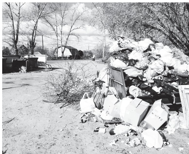
▲ «Красота» города руками жителей