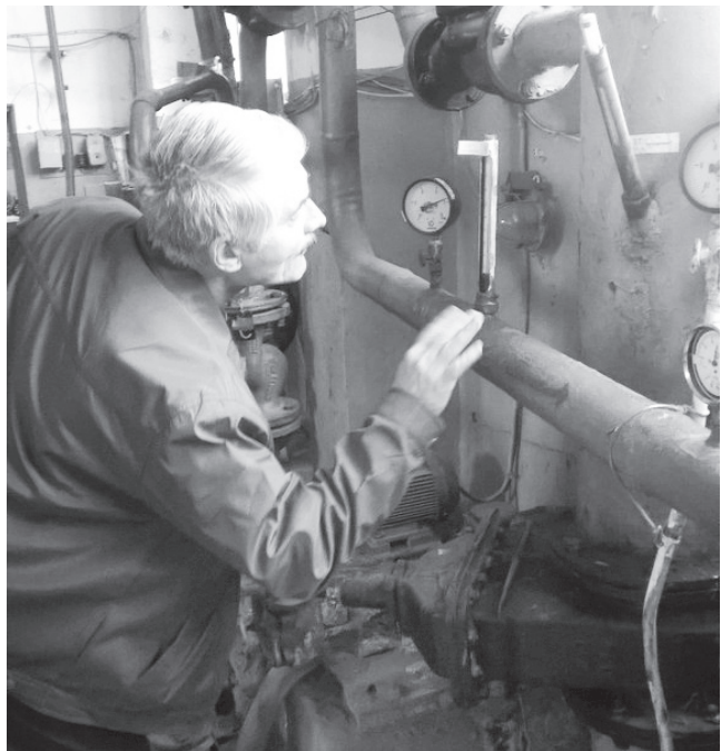
▲ Давление должно быть в норме