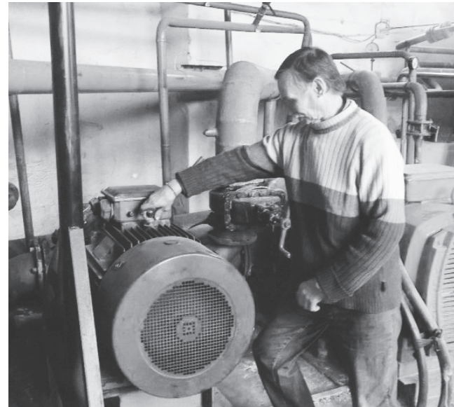
▲ Проверка насосов перед пуском в котельной №5