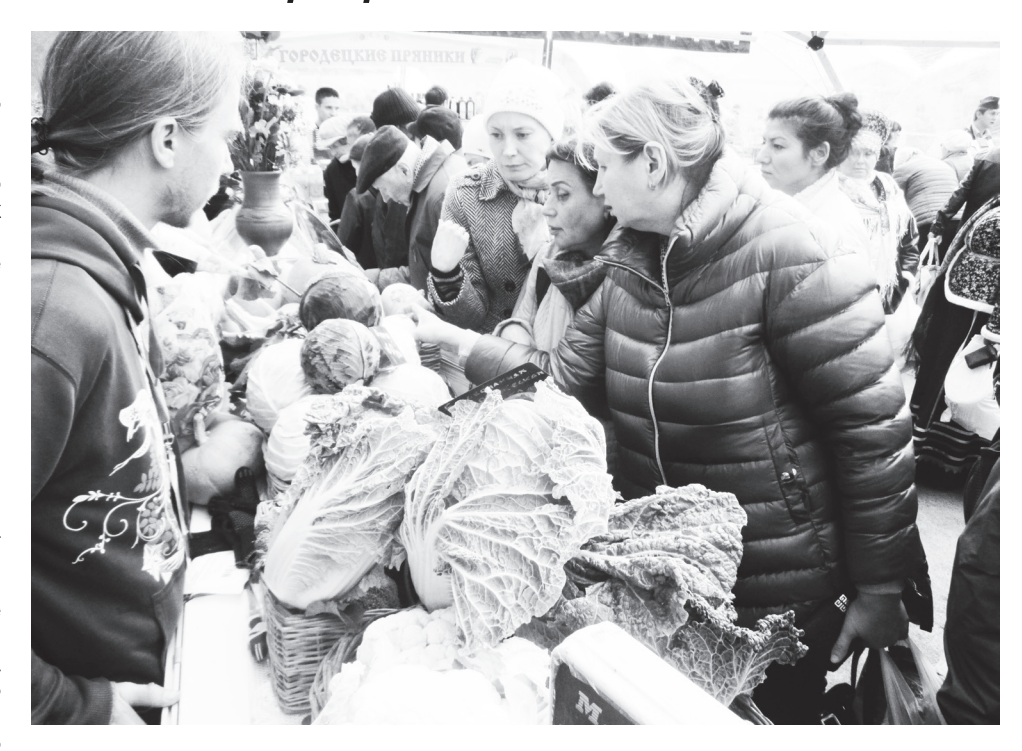
▲ ООО «Чудь» представило широкий ассортимент оригинальных овощей

Почувствовать наметившиеся тенденции, увидеть то, что ждет в перспективе – с этими намерениями наше семейное хозяйство ООО «Чудь» в который раз побывало в Москве на традиционной выставке-ярмарке «Золотая Осень»