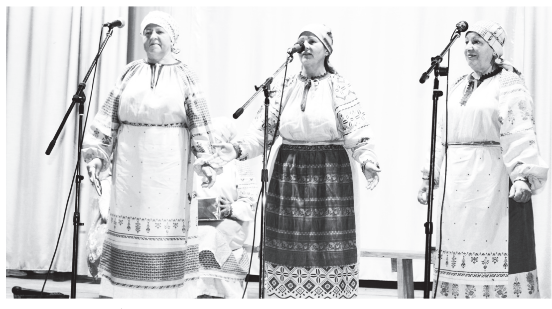
▲ На сцене участницы народного фольклорного ансамбля «Радоница»

– Временем никогда не стереть из памяти мою первую встречу с клубом. Тогда, в феврале 1992 года, я еще не знала, что это была встреча на всю жизнь, но я почему-то сразу поняла, что это не просто клуб –