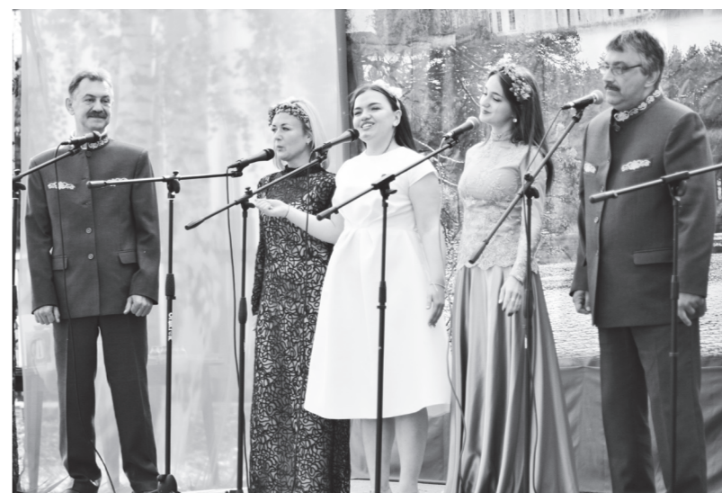
▲ Вокальный ансамбль «Соборяне» из Выксунской епархии