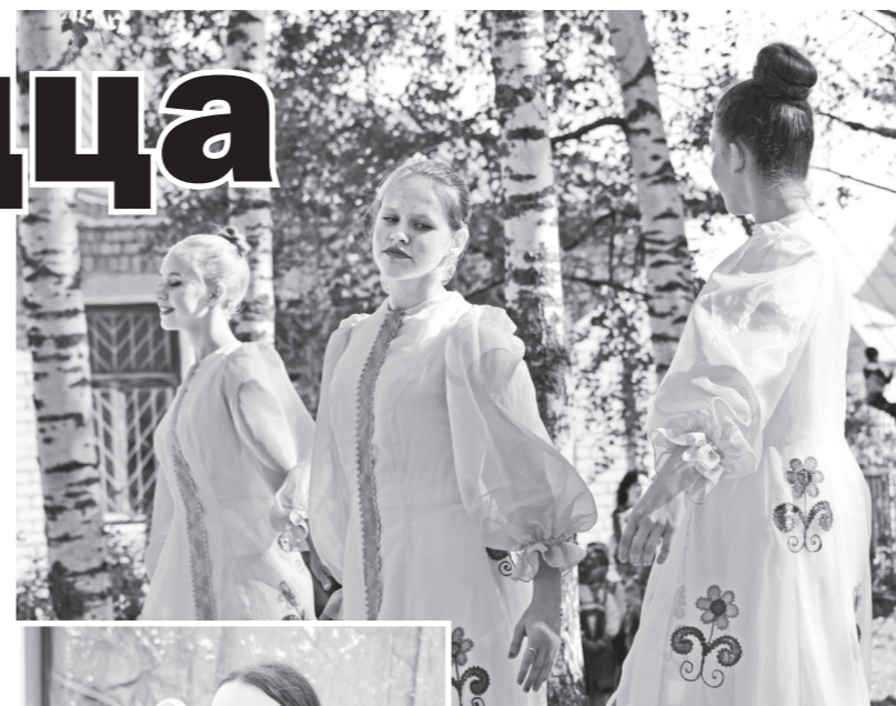
▲ Украшением фестиваля стали также и танцевальные композиции