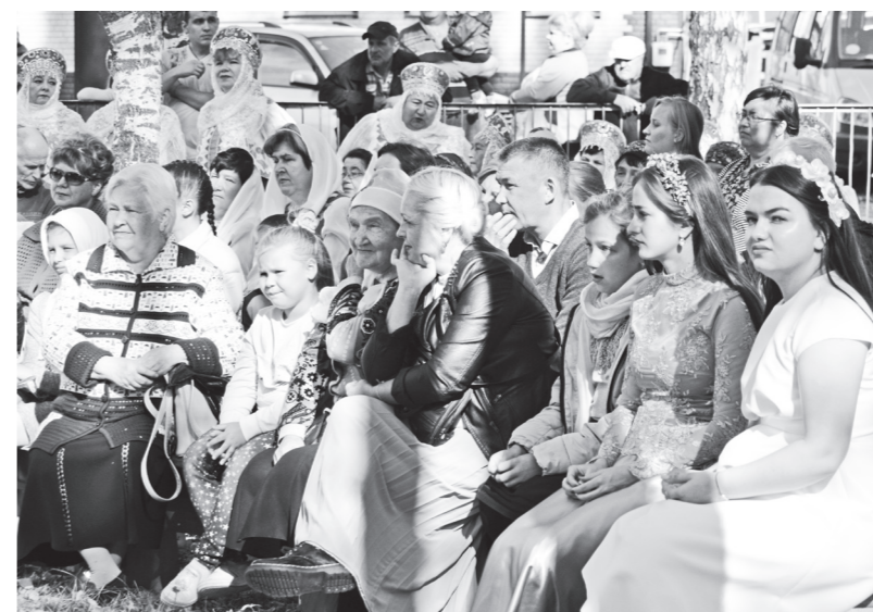
▲ Зрительская аудитория тоже была многочисленной