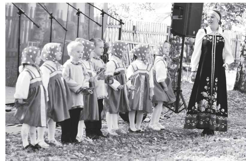
▲ Самые юные участники фестиваля – дошколята. В этот раз их насчитывалось значительно больше, чем в предыдущие годы. На сцене – воспитанники детского сада «7 «Елочка» г. Навашино. Свой вокальный номер подарили и малыши детского сада № 4 «Ромашка» с.Б-Окулово