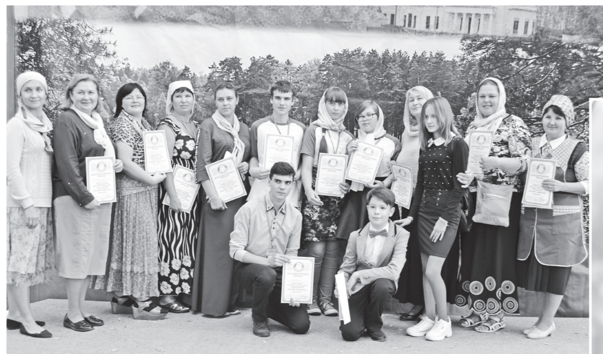
▲ Волонтеры Крестовоздвиженского храма