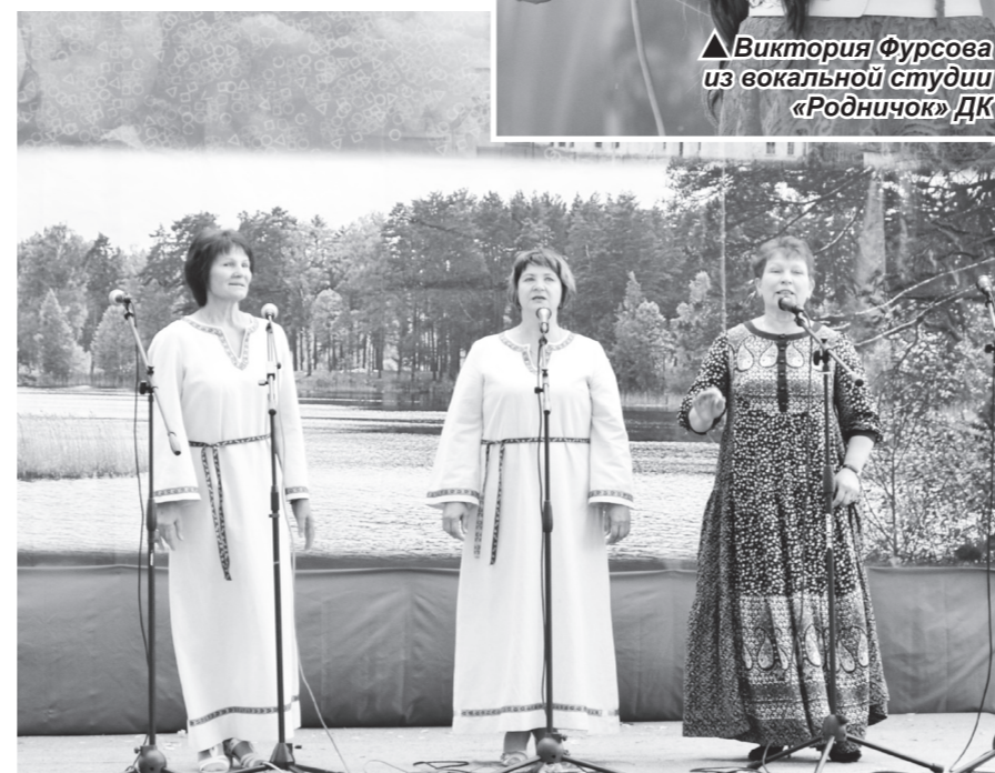
▲ Вокальный коллектив «Ефановские сударушки» Ефановского СДК