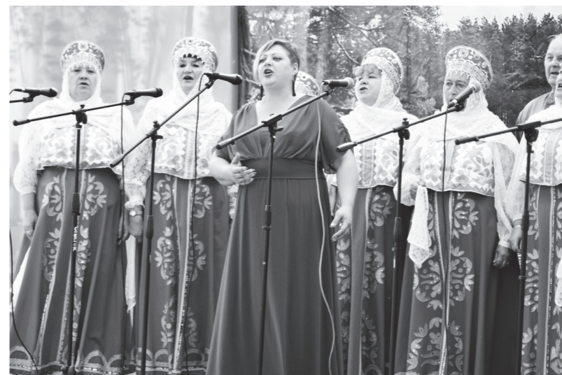
▲ Вокальный коллектив «Иеушка» ДК