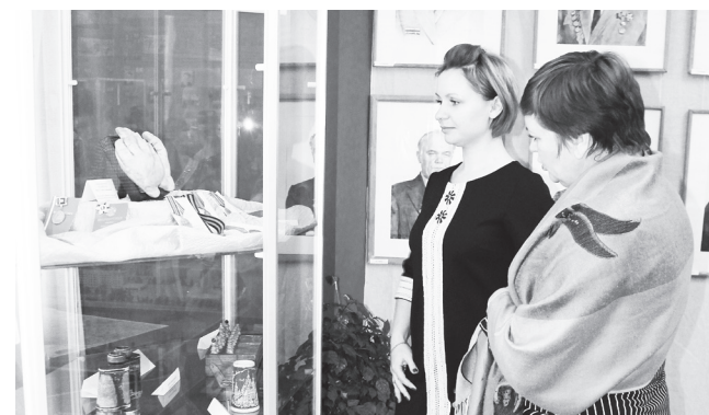
▲ Прониклись всей душой