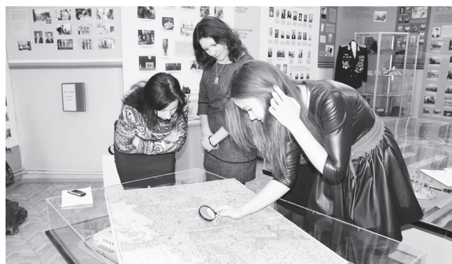
▲ Боевой путь Н.Ф.Терешкина - на немецкой карте