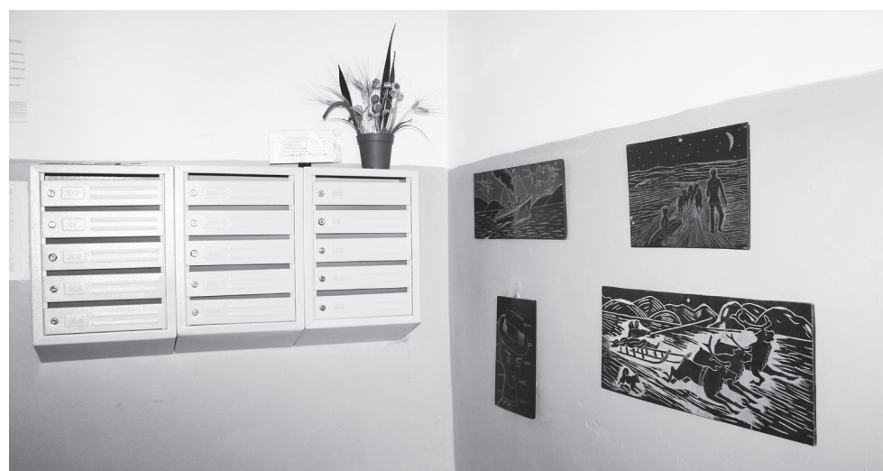
▲ Первый этаж одного из подъездов дома №16 по ул.Ленина