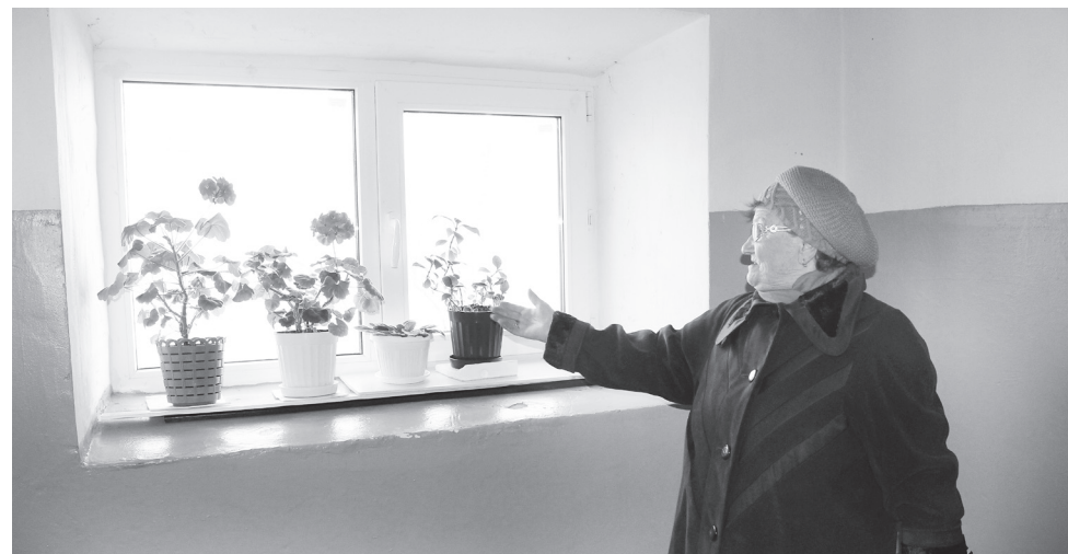
▲ Окно в подъезде

- Все это мы не своими руками делали, а нанимали специалистов, которые прово-