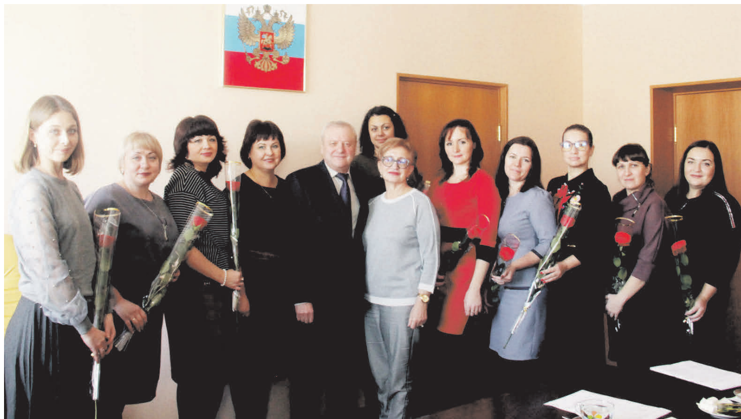
▲ Участники встречи