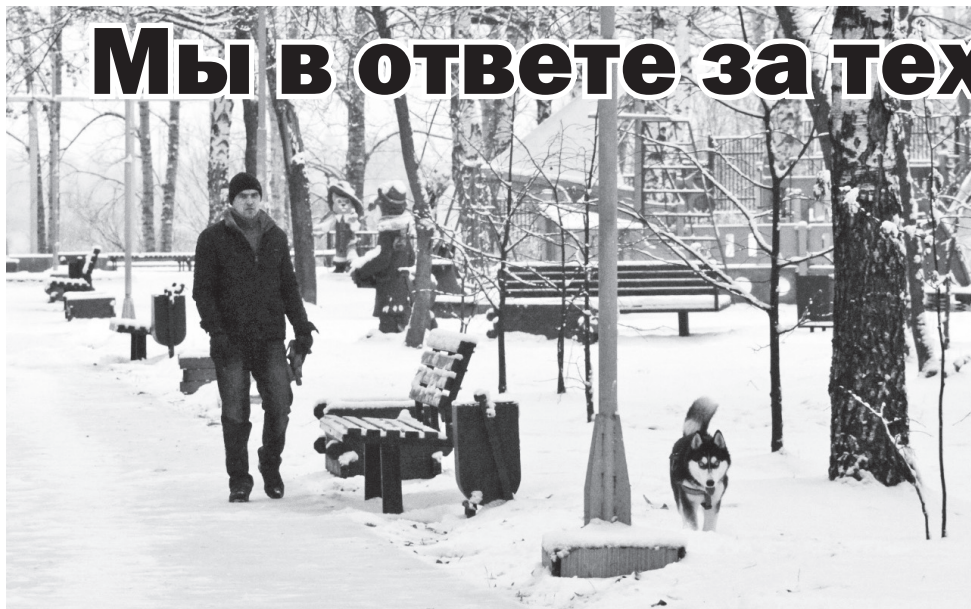
▲ На прогулке

30 ноября - Всемирный день домашних животных