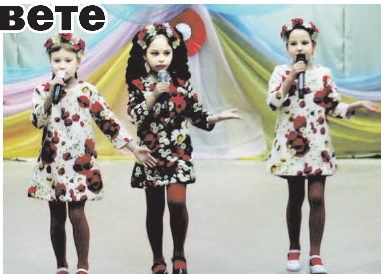
▲ Радость зрителям дарили