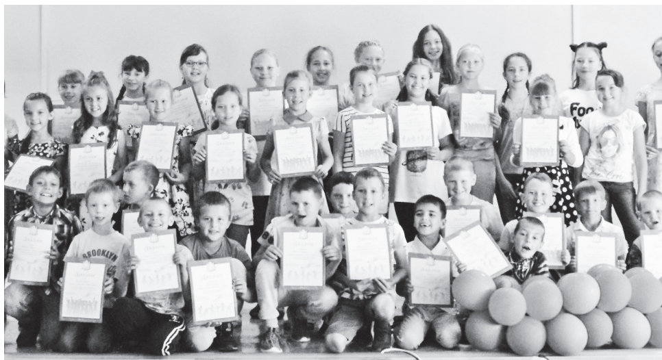
▲ Здесь умеют дружить дорожить, с добрыми делами здесь знакомы

Лагерь на базе МБОУ «Натальинская СШ» работал с 1 августа. В нем отдохнуло 40 детей.