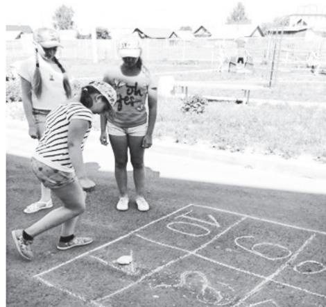
▲ Пробежали без оглядки в летнем лагере деньки