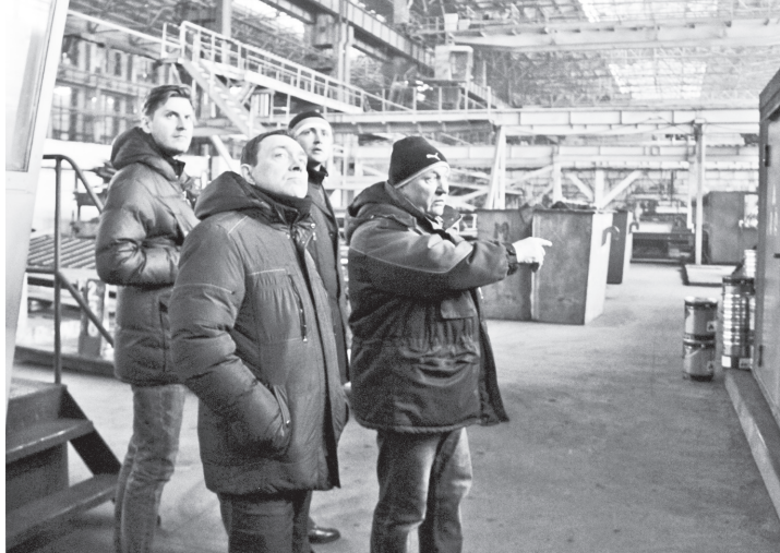
▲ На экскурсии в цехе СК-1 АО «Окская судостроительная»

были предложены промышленным предприятиям округа?