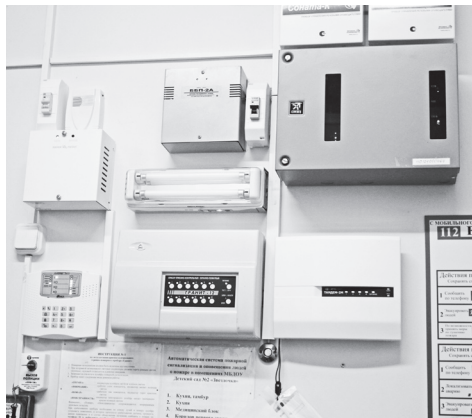
▲ Пульт управления пожарной сигнализацией на одном из объектов

– В результате работы с руководителями образовательных учреждений удалось добиться того, что в начале учебного дня внутренние замки убираются, двери за-