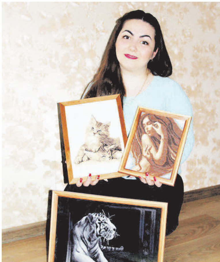
▲ Сколько усилий, терпения – и получилась такая красота!

– Во время учебы в техникуме, зашла как-то в гости к знакомым и увидела картины, вышитые крестиком. Меня сразу это заинтересовало и захотелось попробовать. Купив в магазине набор