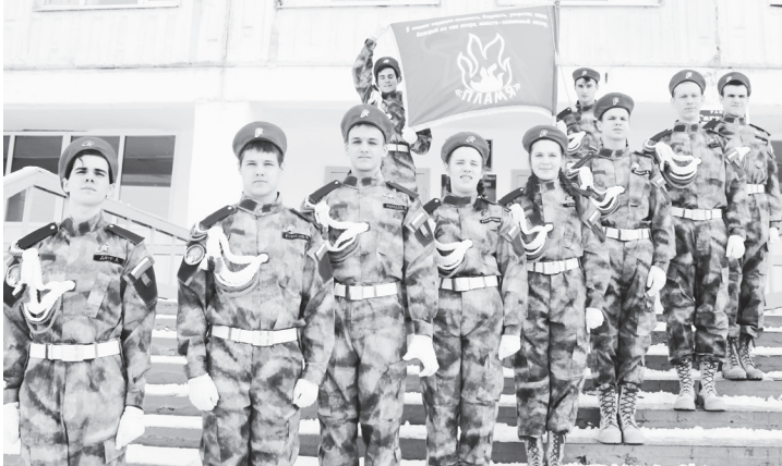
▲ Знамя клуба – наша гордость

На первом этапе «Визитная карточка» – «Знамя клуба – наша гордость!» команда в художественно-театрализованной форме представила городскую округ, школу и знамя своего объединения. На последующих этапах участники отвечали на вопросы военно-исторической викторины «Отчизны славные Победы», выполняли задания «Условные знаки» по знанию топографических и тактических знаков, проходили компьютерное тестирование «Миротворцы» по международному праву войны. Самым зрелищным стал конкурс «Строевая подготовка», в рамках которого оценивались внешний вид участников, строевая выучка членов команды, выполнение строевых приемов с Государственным флагом. Самым трудным этапом стало прохождение «Маршрута выживания». Юнармейцы преодолевали туристические препят-