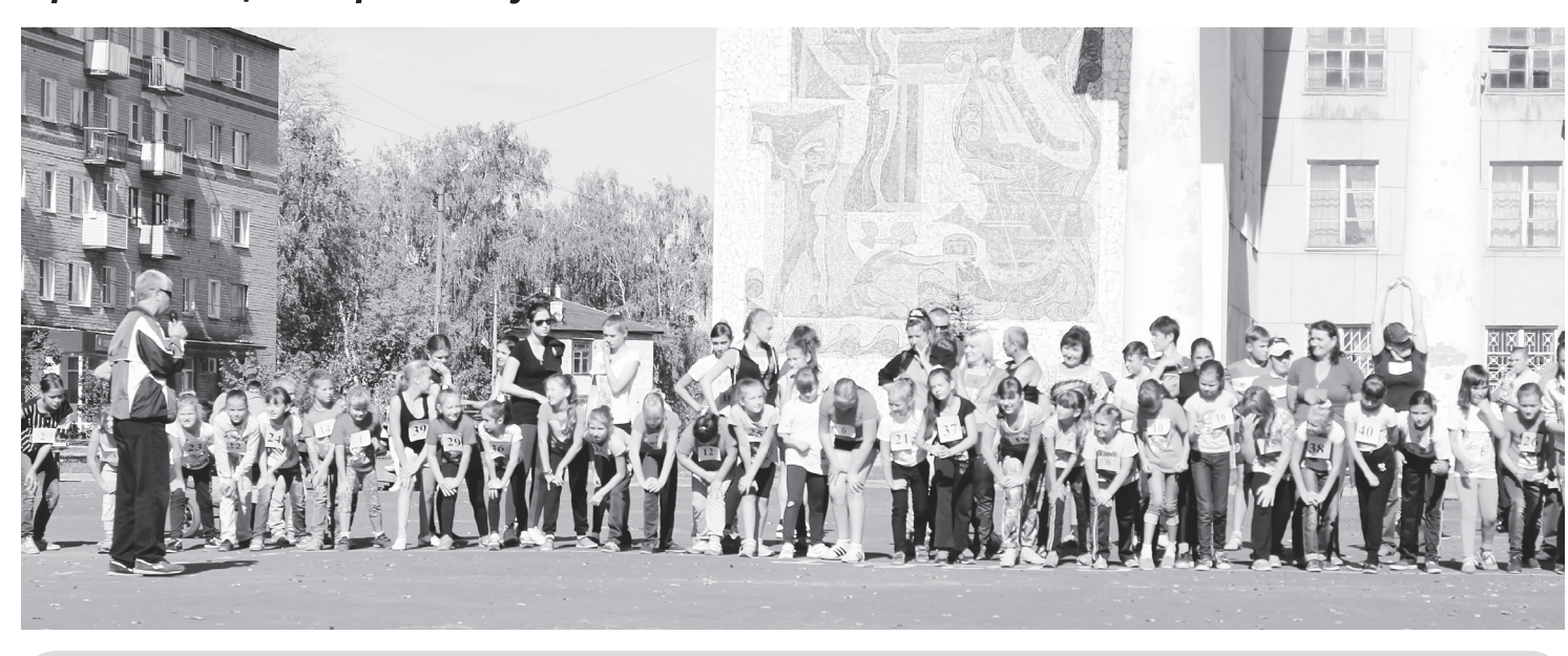
В массовом забеге приняли участие 306 навашинцев. Это воспитанники детских садов, школьники, учащиеся техникума. представители Ледового дворца «Флагман», пожарной части, администрации района, работники ОАО «НЗСМ», «Окская судоверфь», «Навашинский хлеб» и индивидуальные предприниматели.