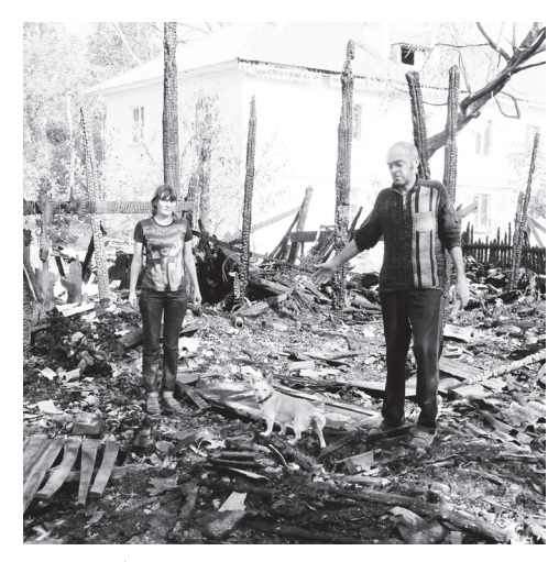
🛦 Все, что осталось от сараев

- В Навашине уже горели блоки сараев в районе техникума, возле бывшего военкомата, около пяти лет назад также горели сараи на улице 50 лет Октября. Пока о причинах возгорания говорить рано, сейчас по делу ведется расследование, о результатах которого мы проинформируем позже.