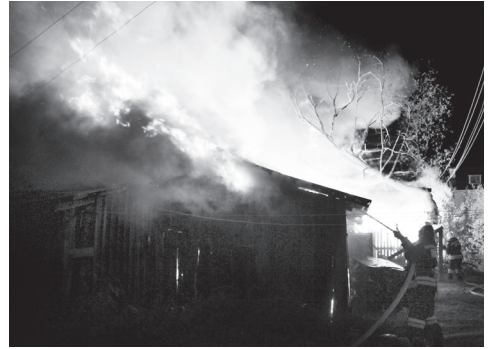
▲ Зарево от пожара было видно со всех сторон города

По словам очевидцев, пламя вздымалось в высоту до уровня крыши двухэтажного дома. В дальнейшем ранг пожара был поднят с 1 до 2 уровня сложности из 5 возможных, дополнительно были вызваны еще шесть машин, из которых две резервные 17 и 40 ПСЧ и три автоцистерны муниципальных пожарных команд Сонино, Коробково и Поздняково. Первым делом пожарные принялись сбивать пламя, направив все силы и средства, чтобы огонь не перекинулся на два жилых дома и ближайший блок сараев.