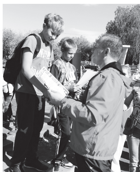
На пьедестале победители забега на 600 метров среди мальчиков 3-5 классов и девочек 1-2 классов в забеге на 300 метров.