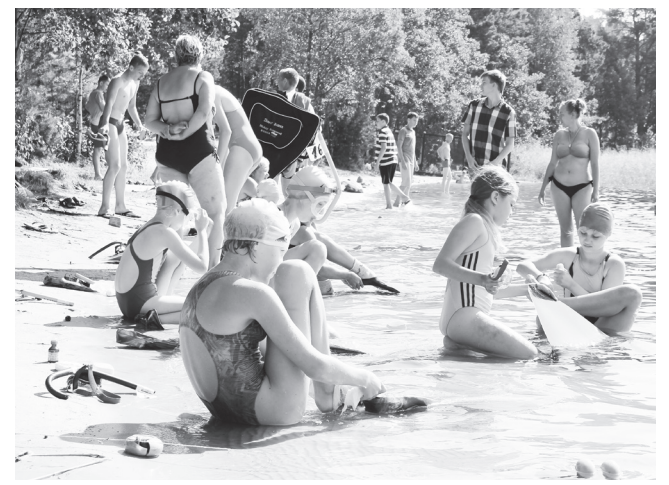
▲ Пятиминутная готовность к старту. У каждого без исключения настрой на победу

Соревнования длились несколько дней подряд. С берега едва ли можно было понять, что происходит на воде, и только когда тренер начинал показывать и объяснять, что к чему, становилось ясно. Удивляли сила, выносливость, стойкость этих совсем юных ребят. Сколько же необходимо энергии, какой нужно обладать пластикой и физической подготовкой для того, чтобы преодолеть заплыв длиной в 6 километров в моноластах? Никто не