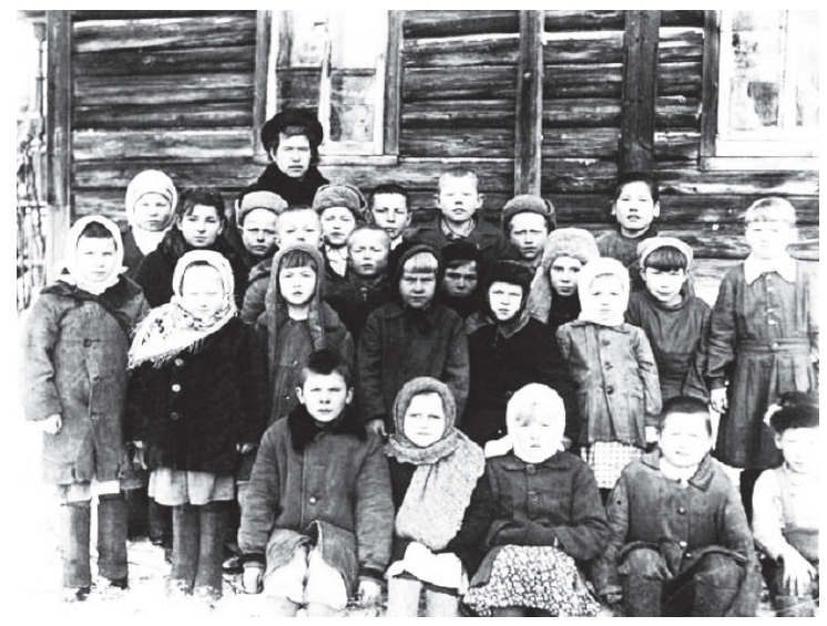
В послевоенные трудные годы

«...Дирекция школы и учительство в своей практической работе мало привлекали родительский актив и до сего времени при школе не организован родительский Комитет»,