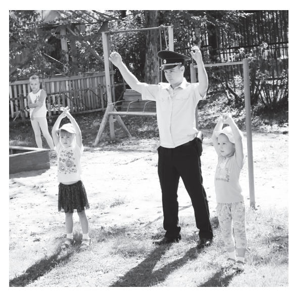
▲ Руки - выше, ноги - шире!