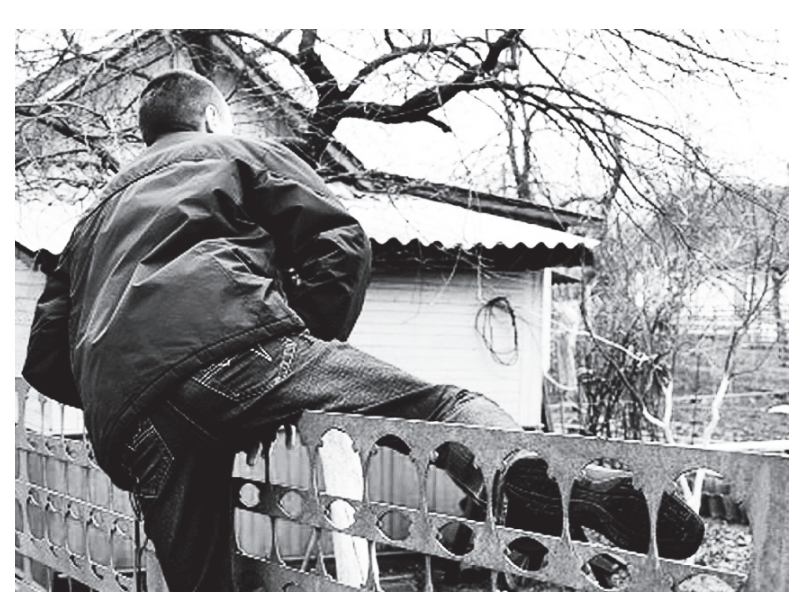
▲ Не пытайтесь задержать вора самостоятельно

рович. - Став свидетелями того. что кто-то посторонний появили пытается что-то украсть, слесотрудников на охрану садовых дует вызывать полицию, чтобы вора задержали на месте. Ни в коем случае нельзя ловить вора журство в своих товариществах. самостоятельно, так его можно лиция должна обеспечивать со-Такой патруль должен включать спугнуть. Кроме того, преступник хранность выращиваемых куль-