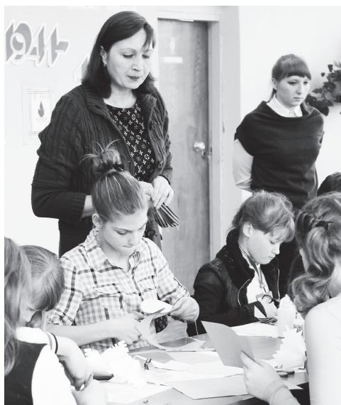
▲ Участники акции вырезают детали для открытки