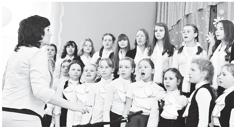
▲ Нет на сердце лучшего момента, Если хор возвышенно поет...