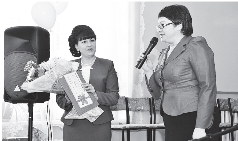
▲ Подарочный сертификат для ДШИ на покупку рояля от районного управления культуры

Именно в этот весенний месяц, сравнимый с легкой приятной музыкой, прошло одно из значимых событий района. Детская школа искусств отметила свое пятидесятилетие. В ее концертном зале собралось много гостей на большое торжество. В программе, конечно же, были поздравления и пожелания, вручение наград и подарков. Вся эта церемония проходила в музыкальном оформлении, своеобразном ливне нот, номера которого состояли из выступлений не только педагогов, но и воспитанников школы. Причем, были среди них дети от самых младших классов до старших. И каждый из выступавших, в том числе и юных талантов, без сомнения был на высоте. Со сцены, оформленной воздушными шарами, букетами роскошных роз и хризантем, лилась музыка, песни и стихи. Зал восторженно аплодировал.