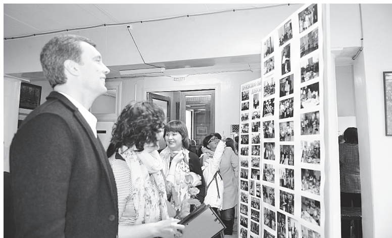
▲ Фотовыставка достижений воспитанников ДШИ