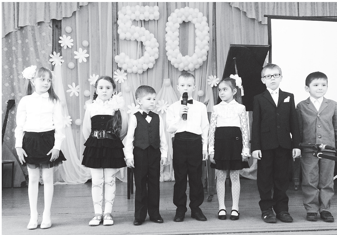
▲ На сцене - самые юные таланты школы