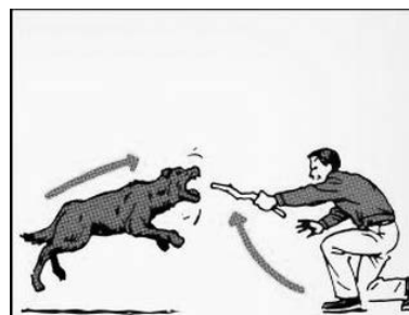
3. Если вы видите, что собака собирается напасть, поместите что-нибудь между вами – палку, пиджак, что-то, что защитит вас.

Если собака больна, то вы это увидите по ее болезненному виду. Такую собаку скорее всего не получится успокоить. Главное правило при любом нападении – это вооружиться. Можете использовать подручные средства: тяжелую сумку, ключи и т.д. Возьмите с земли палку, бутылку или камень. Обычно такое поведение пугает собаку. Собака видит, что вы потянулись за «оружием» и, как правило, отступает. Однако с большой собакой такой трюк не пройдет. Если у вас нет сумки, а на земле нет камней и палок, то зачерпните с земли горсть песка