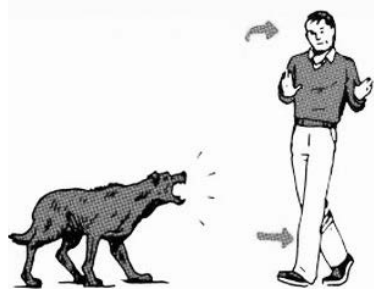
2. Не убегайте от собаки и избегайте зрительного контакта; медленно отойдите от животного.

2. Собака подбегает к вам на улице и начинает лаять на вас. Если собака на вас лает – это не значит, что она собирается напасть на вас. Обычно собака лает, если хочет увидеть реакцию человека. Лай собаки носит пре-