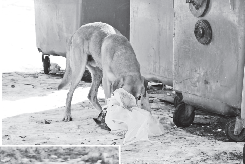
▲ Собака бывает кусачей только от жизни собачей

– Во-первых, немедленно нужно промыть рану щелочным раствором, он нейтрализует и замедляет действие вируса. Во-вторых, обязательно обратитесь за медицинской помощью для назначения курса лечения. Однако очень часто укушенные люди, особенно домашними собаками, пытаются обойтись без посещения больницы. И бродячие, и домашние псы являются переносчиками целого ряда опасных заболеваний, одним из которых является бешенство. Эта болезнь смертельна для человека. Бешенство передается через слюну больных животных, которая попадает при укусе на кожные покровы человека. Поэтому пострадавшему немедленно нужно обратиться в больницу, – прокомментировала заме-