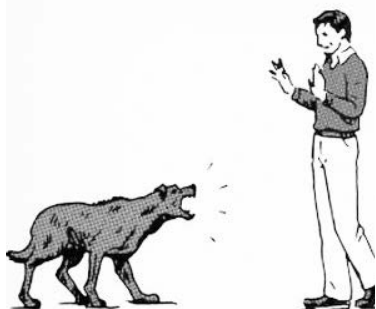
1. Стойте спокойно. Страх и агрессия разозлят собаку еще больше.

1. Собака просто подбегает к вам на улице. При этом важно сразу определить «намерения» собаки. Обычно собаки подбегают к людям, если от людей пахнет