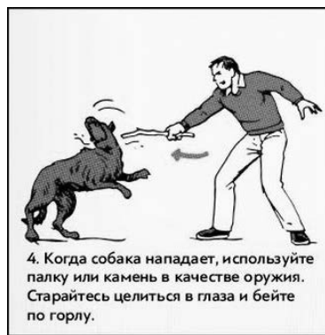
4. Когда собака нападает, используйте палку или камень в качестве оружия. Старайтесь целиться в глаза и бейте по горлу.

Первое, что вам нужно сделать – это трезво оценить свои силы. Если на вас собирается напасть маленькая собака, то в большинстве случаев будет достаточно громкого крика-рыка. Если вы боитесь, то кричать не нужно. Потому что тогда ваш крик будет похож на вопль умирающего. Ваша цель – показать собаке своим криком, что вы опасны. Крикните как можно громче и яростнее. Однако, если вы попробуете крикнуть на крупную собаку или стаю собак, то это могут