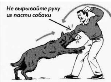
Не вырывайте руку из пасти собаки

Обращаем ваше внимание на то, что бездзорные собаки будут отлавливаться соответствующими службами, а к владельцам собак будут применяться штрафные санкции.