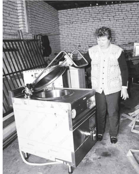
▲ Новое оборудование для пищеблока