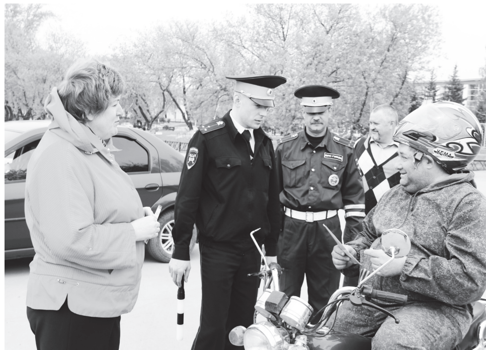
▲ Участники акции напоминали водителям о том, что высокая скорость опасна