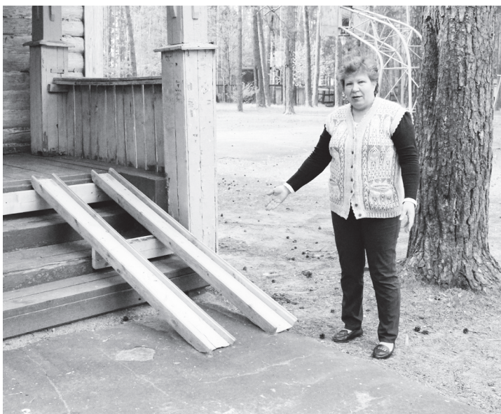
▲ Для комфортного пребывания детей с ограниченными возможностями оборудован пандус