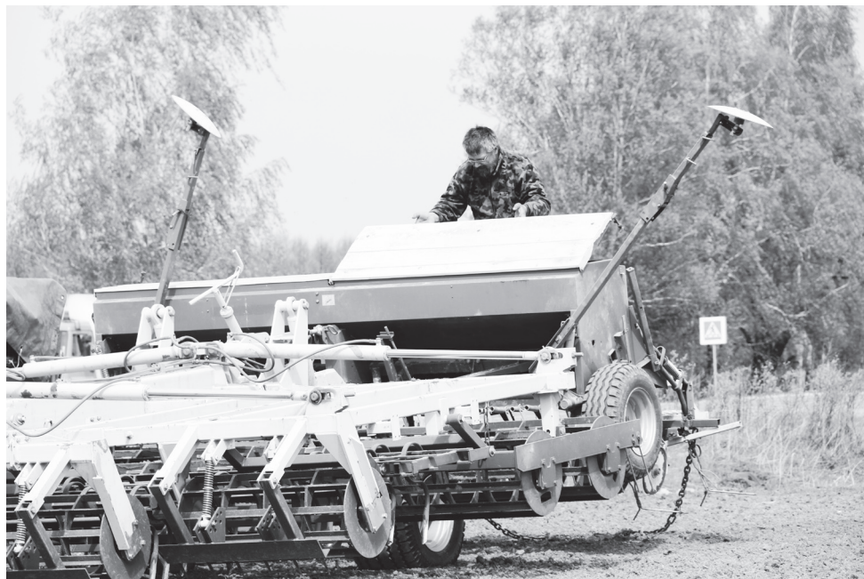
▲ Техника готова к посевным работам