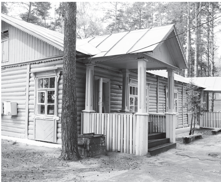
▲ Яркими смотрятся корпуса после покраски в теплые и насыщенные цвета

Первая смена будет работать с 5 по 25 июня, вторая с 29 июня по 19 июля, а третья – с 23 июля по 12 августа. По вопросу приобретения путевок следует обращаться в «Навашинский центр дополнительного образования детей» по телефонам 5-67-73, 5-79-48.