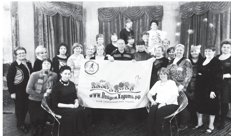
▲ На праздник, организованный по случаю дня рождения клуба, собралось 30 человек

– Как правило, многокилометровые дороги пролегают по культурным, историческим местам, с посещением музеев, выставок, где мы делаем остановки, отдыхаем и в то же время попутно расширяем свой кругозор. О чем-то я рассказываю, вычитываю сведения из литературы, газет, у меня собран богатый краеведческий материал, дополняют и другие члены клуба. Время в пути проходит незаметно, с колоссальной пользой не только