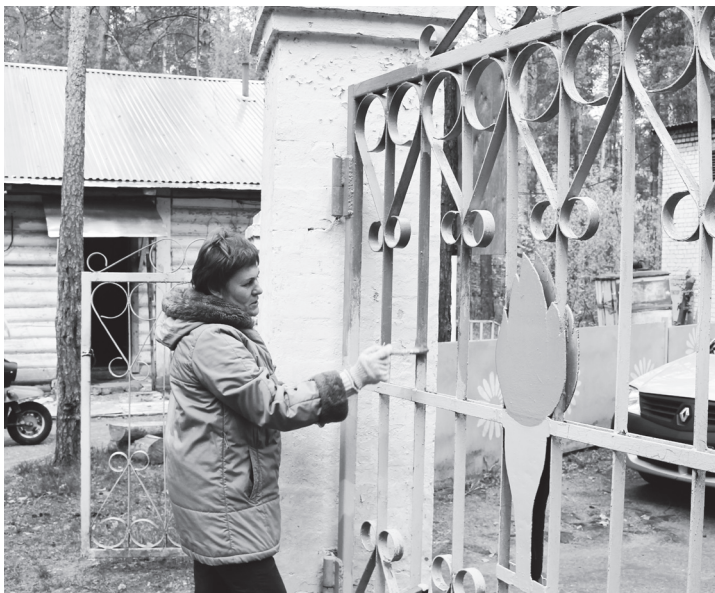
▲ Обновленными выглядят и ворота