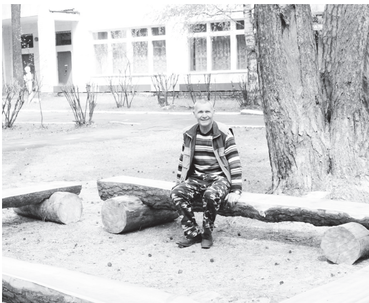
▲ На лавочках, сделанных из аварийных деревьев, удобно отдыхать