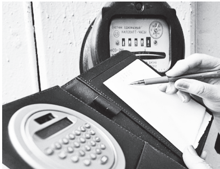
▲ Недобросовестные потребители будут выявлены

– Работа компании направлена на то, чтобы уголовно на-