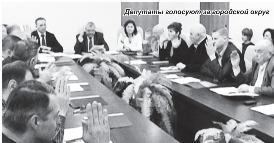
Депутаты голосуют за городской округ

- И хочется, чтобы он действительно обеспечивал важные потребности населения, оказывая решающее влияние, прежде всего, на качество жизни навашинец. А у нас сейчас раздут штат чи-