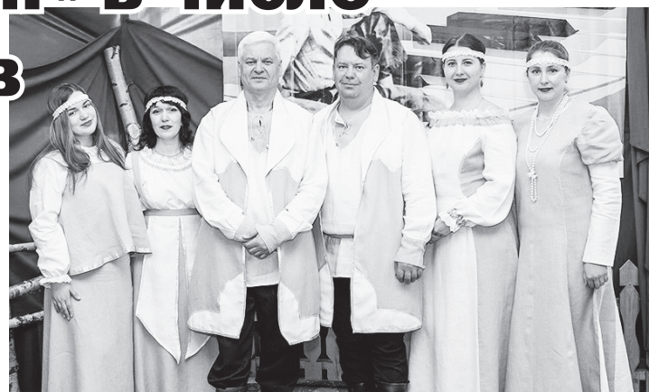
▲ Безупречный вокал позволяет ансамблю «Бумеранг» завоевывать новые награды, а стилизованные костюмы делают образы артистов завершенными

На первый год конкурс традиционно проходил в Новодмитриевском Доме творчества городского округа Выкса 10 июня. Именитое жюри, в составе которого были заслуженные работники и деятели культуры России и Нижегородской области, оценивало выступление конкурсантов по уровню исполнительского мастерства, техничности и артистичности, качеству репертуара, сценической культуре и мероприятиям, оформлению номера в возрастных группах от 15 до 24 лет и от 25 и старше, в номинациях «Вокально-инструментальные ансамбли», «Солисты», «Дуэты и трио»,