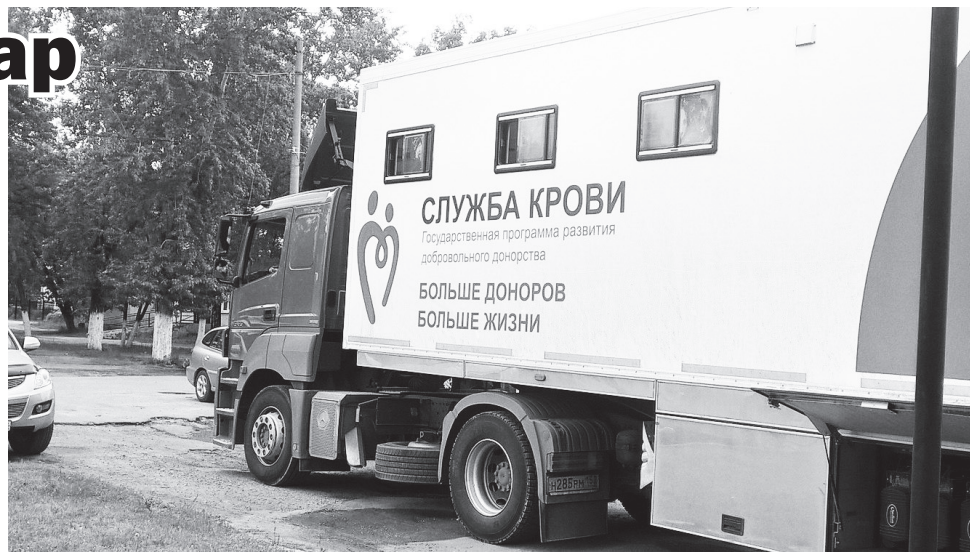
▲ Автомобиль выездной бригады, который курсирует по всем районам и округам нашей области

– Донором может быть любой гражданин Российской Федерации, достигший 18-летнего возраста и имеющий хорошее здоровье. Абсолютное большинство доноров в нашей области сдают свою кровь безвозмездно, т.е. проявляют, таким образом, свое милосердие, благородство и сострадание к больным людям, а денежная выплата, которая выдается каждому донору после сдачи крови, является компенсацией за питание, которое необходимо каждому донору после кроводачи. Процедура донации крови занимает в среднем 15–20 минут. Сдавать кровь можно до 60–62 лет. К этому возрасту у многих людей накапливается достаточно много сопутствующих заболеваний, которые не позво-