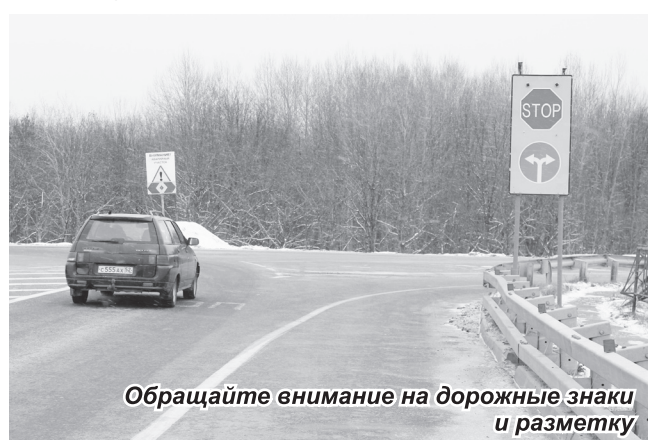
Обращайте внимание на дорожные знаки и разметку.

Как известно, на протяжении нескольких лет в Навашинском районе одним из основных очагов аварийности является 155 км трассы Н.Новгород-Касимов на подъезде к мосту через р.Ока. Только с начала текущего года на этом перекрестке произошло семь ДТП. Никакие «бегущие огоньки», светоотражающие ограничительные знаки о том, что это опасный участок дороги, не работают. Анализ показывает, что все меры, которые принимаются администрацией района совместно с ГИБДД, малоэффективны. Поэтому администрацией Навашинского района и ГКУ «Главное управление автомобильных дорог» по Нижегородской области было принято решение обеспечить уменьшение аварийности путем установки освещения на этом участке дороги, а также отсыпки щебнем и песком 30 м для продления дороги. В настоящее время туда завезено более 100 т щебня и работы идут полным ходом.