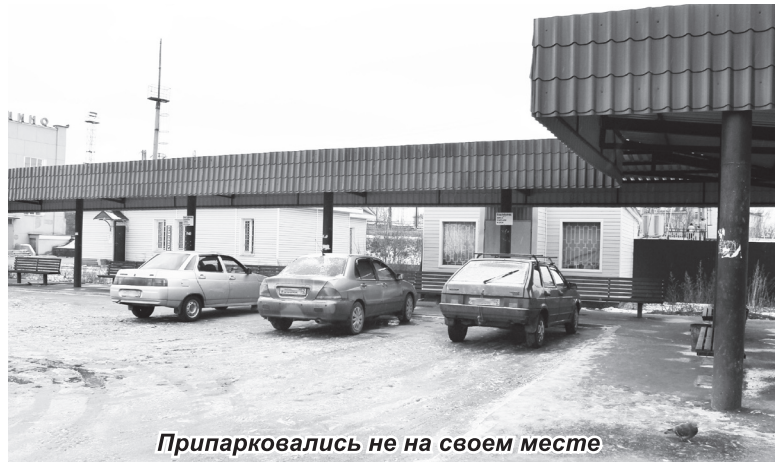
Припарковались не на своем месте

- В ближайшее время планируем поставить ограждение по всему периметру подъездной площадки, чтобы на ее территории не мог находиться никакой другой транспорт, как происходит сейчас. Из-за этого и возникают трудности с организацией подъезда общественного транспорта к платформам. Нередко здесь паркуют свои автомобили водители такси, частные лица. В решении данной проблемы нам уже не раз помогали сотрудники ГИБДД, но они же не могут дежурить здесь круглосуточно!