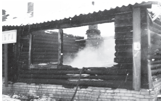
21 октября в селе Монаково произошел пожар на ул. Молодежная, д.4, где распола-

гаются две квартиры и сельский магазин «Ольга» ОАО «НЗСМ». Пожар возник в 00.38, сообщение поступило в 00.50, а первое подразделение прибыло на место происшествия в 01.10. В огне погибла женщина 1938 г.р.