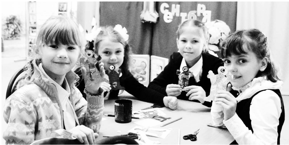
▲ Мастер-класс для увлеченных

подростки изготавливают модели ракет, учатся их запускать, конструировать модели автомобилей и участвовать с ними в конкурсах и соревнованиях, с помощью 3-D программ проектируют технические объекты, занимаются робототехникой.