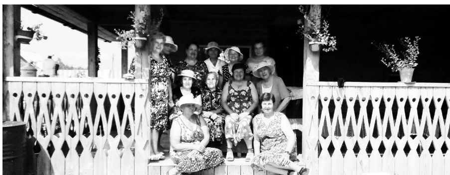
▲ На просторной веранде