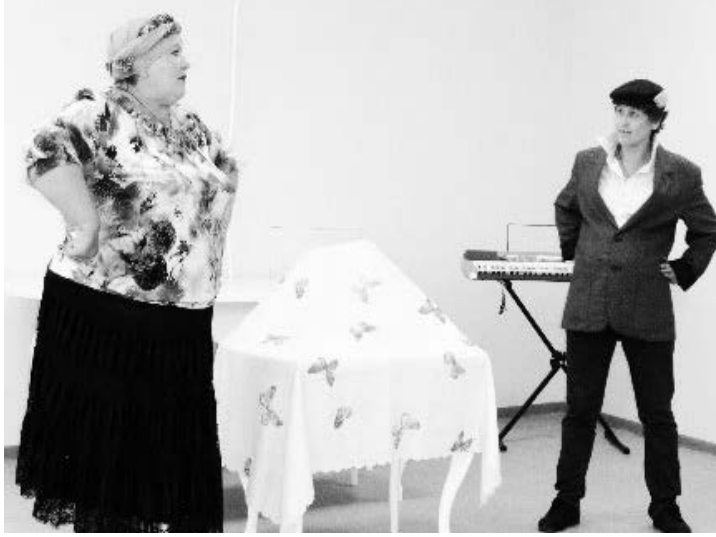
▲ Инсценировка в исполнении участников из г.о. Навашинский