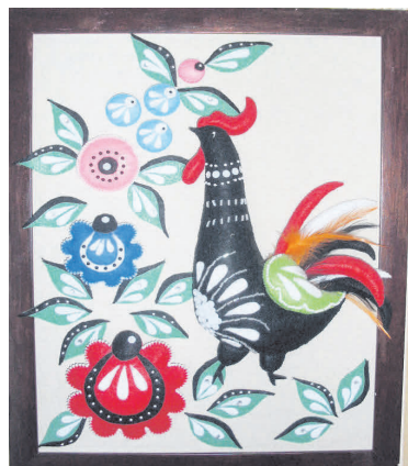
▲ «Городецкий петух»