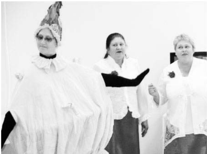
▲ Песня «Самовар» в исполнении участников из Вознесенского района

Цель данного мероприятия: создание социального пространства, соединяющего пожилых граждан – получателей социальных услуг и социальных работников, способствующего развитию творческого потенциала, культурной самобытности, умению адаптироваться к условиям современной жизни. Участие приняли представители Ардатовского, Вознесенского районов и городского округа Навашинский.