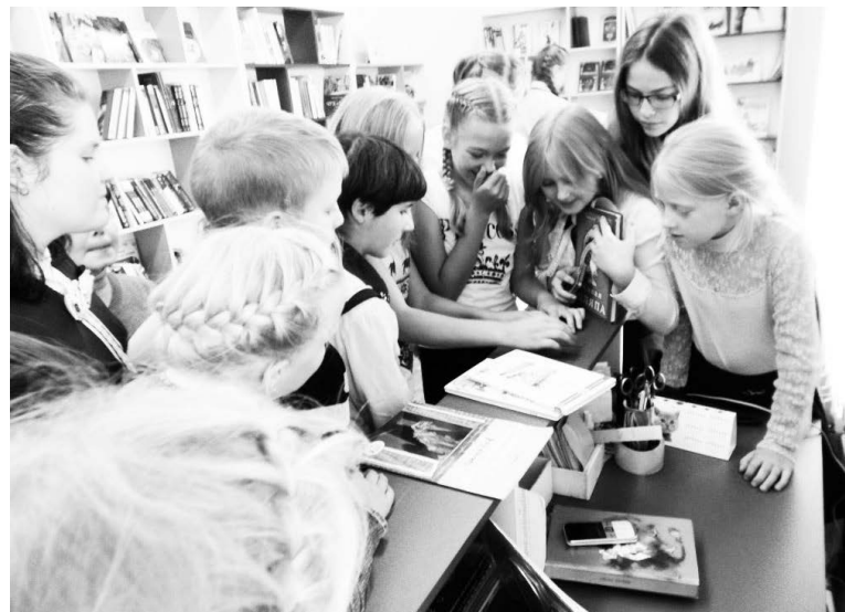
▲ В атмосфере загадочного