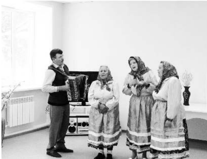
▲ Выступление ансамбля «Майданочка» из Ардатовского района