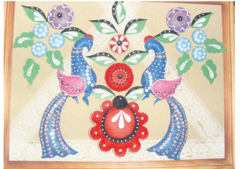
▲ «Райские птицы»

я сделала панно «Совы в осеннем лесу». Работа участвовала в благотворительном фестивале в Москве в 2016 году. В проекте «Весна на Покровке», проходившем в