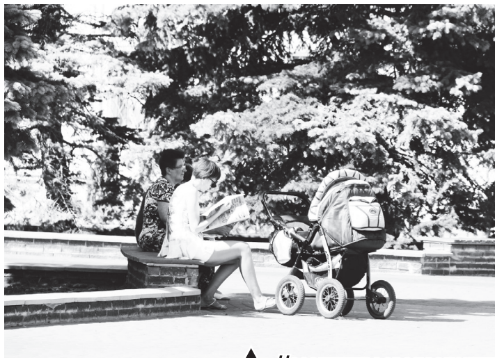
▲ Навашиноцы сразу оценили удобство новых скамеек на площади. Еще продолжаются ремонтные работы, но они не мешают горожанам для комфортного отдыха. Ведь так приятно отмечать, как преобразуется город

Произошли 2 аварии в системе холодного водоснабжения, которые были устранены в установленные сроки. На следующей неделе будет произведена противопожарная опашка