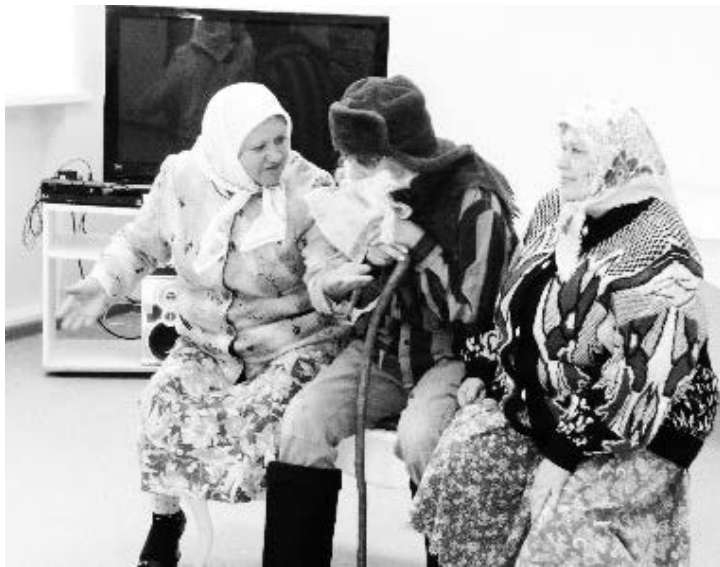
▲ Участники из Вознесенского района