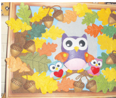
▲ «Совы в осеннем лесу»