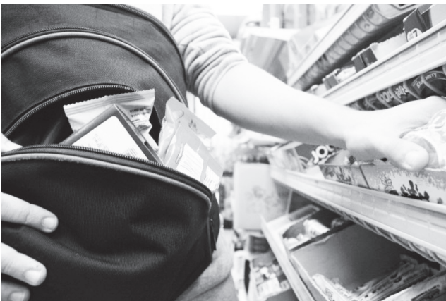
▲ К сожалению, случаи мелкого хищения подростками – не редкость

Также рассматривался материал в отношении молодой семьи, имеющей двухмесячного ребенка. Мать нашла себе другого партнера, оставила ребенка у бабушки в другом городе, а сама уехала. Отец забрал малыша и привез домой. На комиссии рассматривался вопрос о постановке этой семьи на контроль органов системы