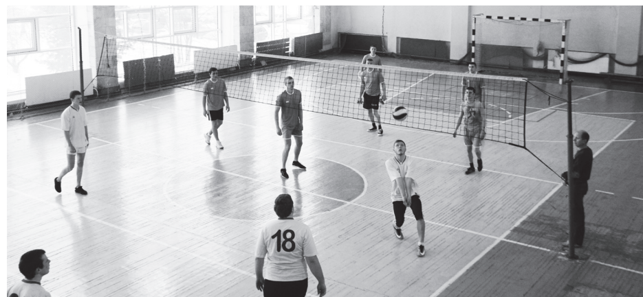
▲ В упорной борьбе победа досталась команде техникума

После сыгранных трех партий, в упорной борьбе со счетом 2:1 победила сборная техникума. Участники мероприятия показали высокий уровень физической подготовки и стремление к победе. В завершении матча игроки обменялись дружеским рукопожатием и сфотографировались на память.