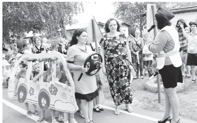
▲ Путешествие по автогородку