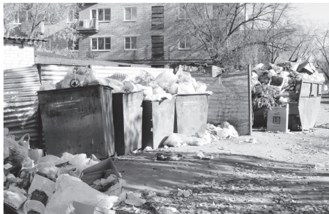
▲ Мусорные баки в районе ул.Соболева, 2013 г.

В ускоренном порядке происходил процесс перезаключения договоров с новой компанией ООО «ЖЭК, благоустрой-