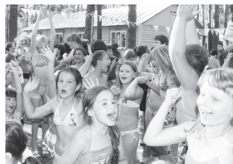
▲ Детский оздоровительный лагерь «Озеро Свято», июль 2014 г.

Что касается оздоровительного лагеря «Озеро Свято», то он принят, обработана препаратом против клещей вся прилегающая территория лагеря, а также в соответствии с санитарно-эпидемиологическими нормами – 50 метров от территории. Установлена дополнительная секция на пляже, чтобы препятствовать проникновению посторонних лиц. Заключен договор с охранником предприятия. В этом году мы отремонтировали туалет, умывальники и «ногемойки», установили в некоторых корпусах пластиковые окна, провели декоративный ремонт. Согласованы с управлением образования по плану координационным советом оздоровление детей в три смены. Из нашего района планируется оздоровить в загородном лагере 174 ребенка. Все желающие могут приобрести путевку в наш лагерь за наличный расчет, стоимость которой составляет 13016 рублей. 1 смена сформирована, заезд намечается на 5 июня, вторая смена начнется с 29 июня и 3 смена – 23 июля, график не меняется. Пока есть свободные места на все смены в загородном лагере. Мы приглашаем специалистов из дополнительно-