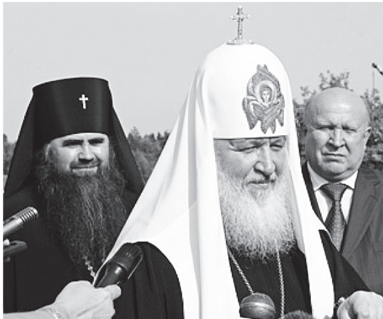
▲ Патриарх на нижегородской земле

- Каждый год мы имеем возможность торжественно проводить богослужения с большим количеством паломников: 1 августа в Дивееве устраивается замечательный палаточный лагерь - это Ваше ноу-хау, которое было восстановлено, когда праздновалось 700-летие преподобного Сергия в Сергиевом Посаде. Пример