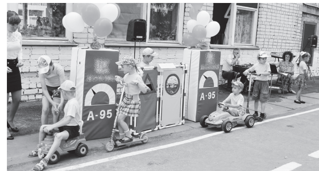
▲ На заправку!

- Компания «Лукойл» всегда активно поддерживает социально значимые проекты, в том числе и направленные на развитие детского досуга, потому что дети –